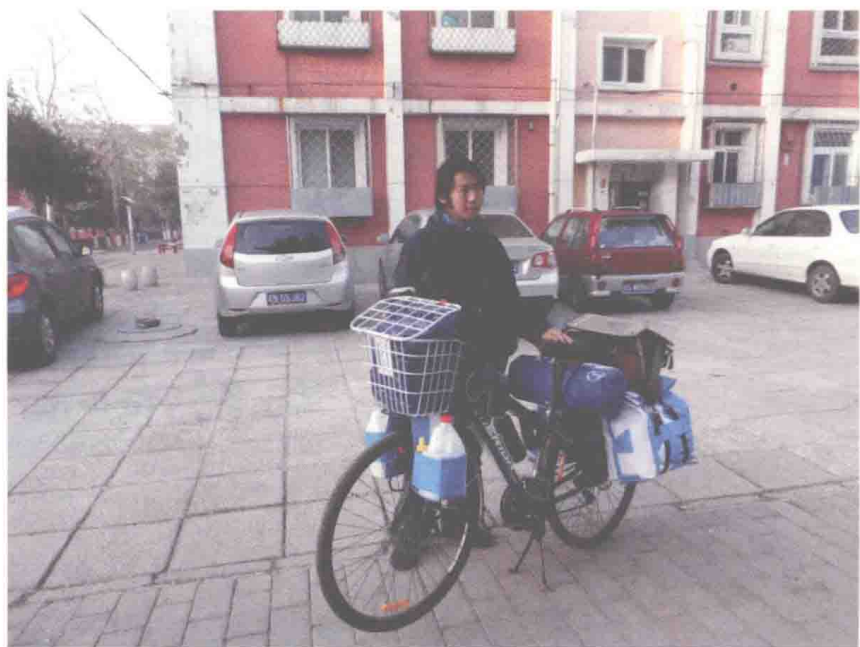
2013年4月24日，一个普通的清晨，我上路了