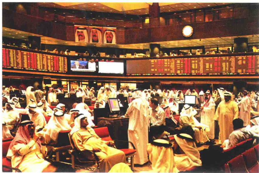
科威特城股票交易所