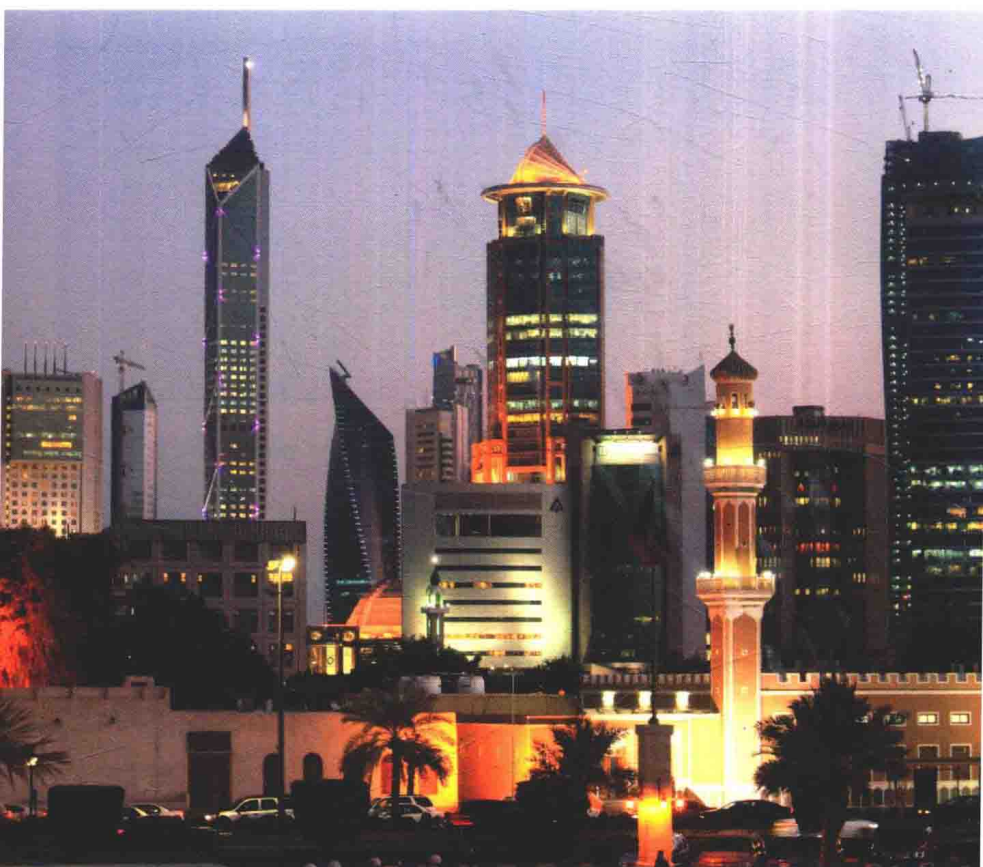
科威特城摩天大楼