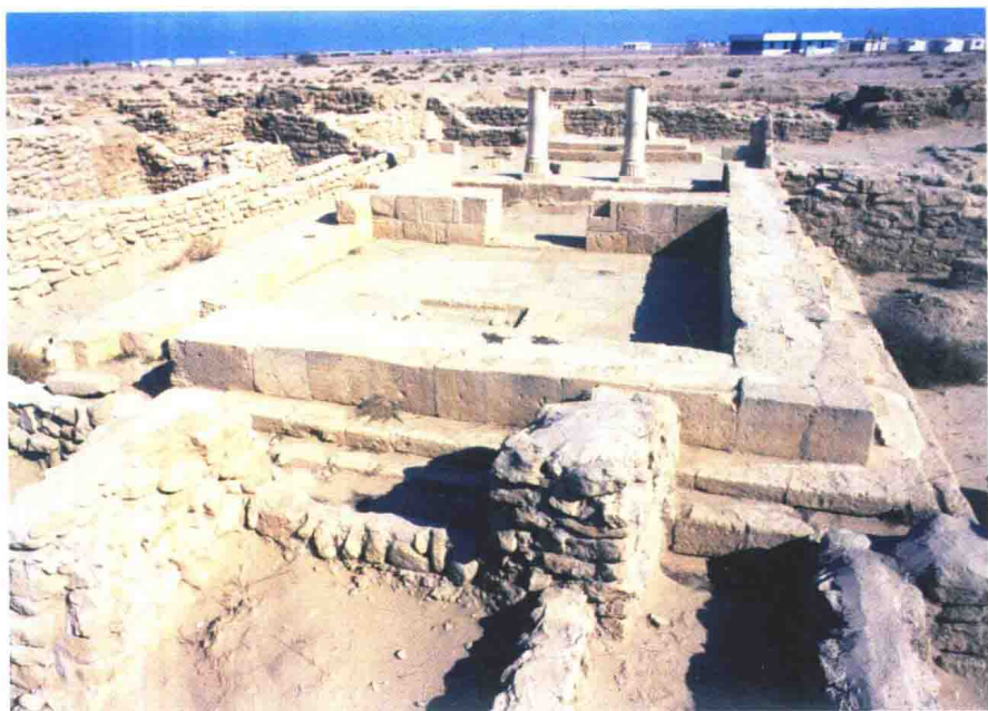
科威特法拉卡岛遗址