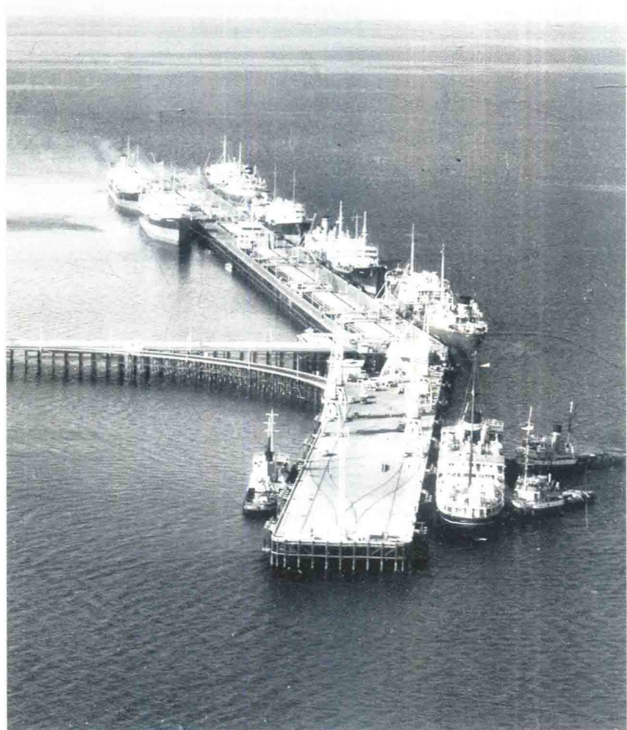
科威特艾哈迈德港