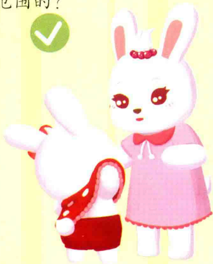
老师帮小朋友换衣服