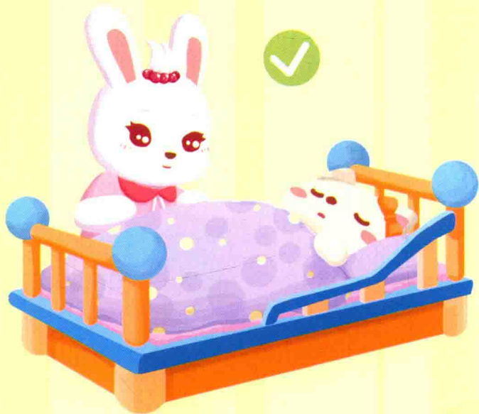
老师照着小朋友午睡