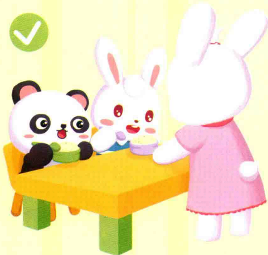
老师给小朋友分发食物