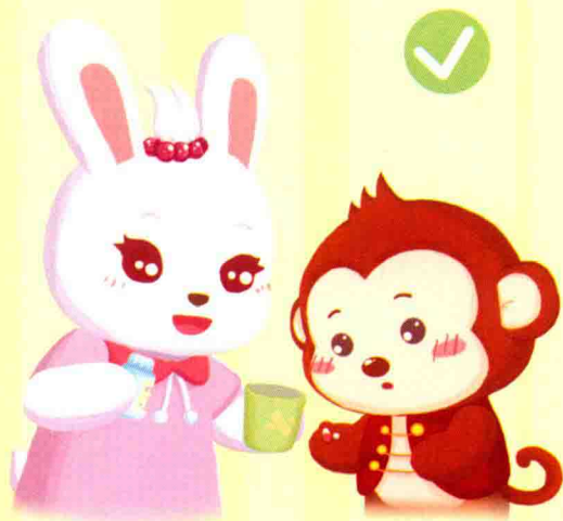
老师给小朋友喂食