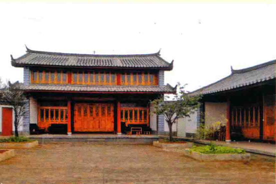
文化活动中心建设