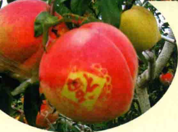
驰名中外的丽江雪桃