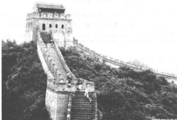
图 1-1 万里长城——居庸关长城哨口八达岭

万里长城是举世闻名的中国古代国防建设,是城池建设的延续和发展。在2 000多年间,各代王朝修建了许多长城。仅以明长城为例,它东起辽宁丹东鸭绿江畔的虎山,西至甘肃嘉峪关,穿过崇山峻岭、山涧峡谷,绵延起伏8 851.8 km,横跨中国北方十个省、市、自治区。早在春秋战国时期,各国为了御敌,便据险修筑城墙。秦始皇统一中国后,把分段的防卫墙连接起来,建成规模宏伟的万里长城,以后各朝又陆续加固增修。到了明代(公元1368~1644年),在旧筑的基础上逐渐改建成今天的面貌。长城沿途有不少地势险要的关口,居庸关及其哨口八达岭(见图1-1)就是其中之一。八达岭为居庸关前哨,两地相距约10 km。八