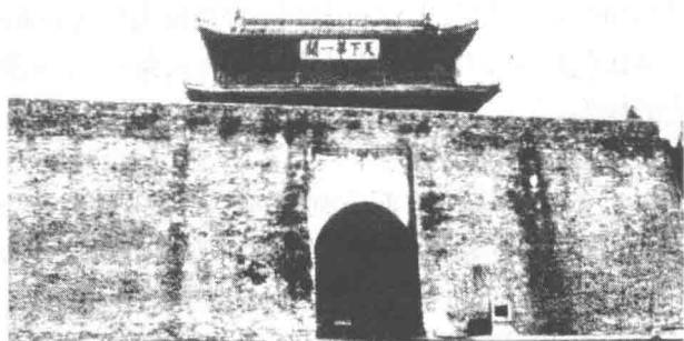
图1-2 中国古代的军事要地——山海关

雄关是中国古代的军事要地。著名的关口有山海关(见图1-2)、居庸关、娘子关、雁门关、玉门关、嘉峪关、虎牢关、武胜关、潼关、镇南关等。