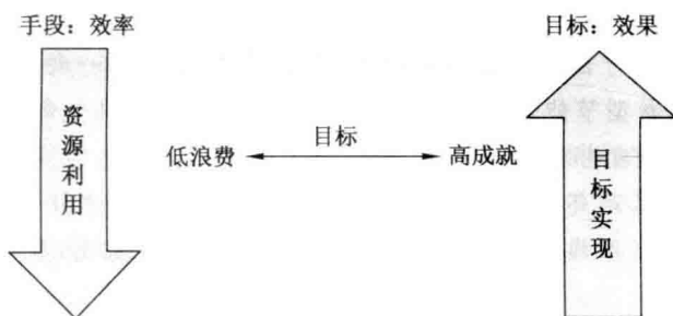
图 1-2 效率与效果的关系

说明了管理创新的重要性,认识到这一点,也有助于我们克服重技术、轻管理的倾向,真正把技术和管理看做推动经济起飞的两个轮子。