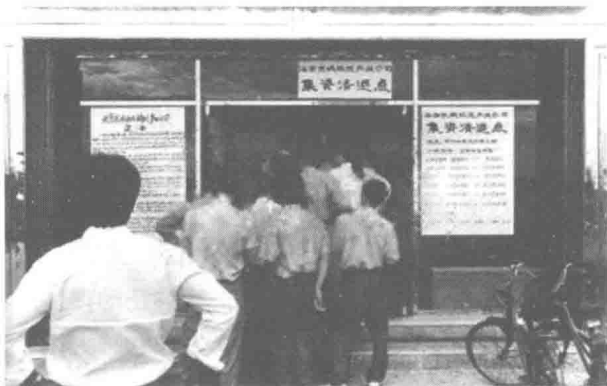
▲海南长城公司违法集资清退点

状称，沈太福多次以借款的名义，从自己公司的集资部提取社会集资款，构成了贪污罪。他还先后向国家科委副主任李效时等21名国家工作人员行贿钱、物等合计人民币25万余元，构成了行贿罪。法院于