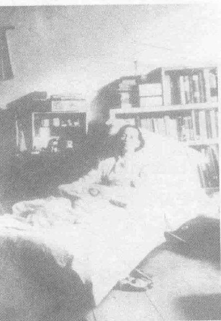
1941年，林徽因病中在四川南溪李庄