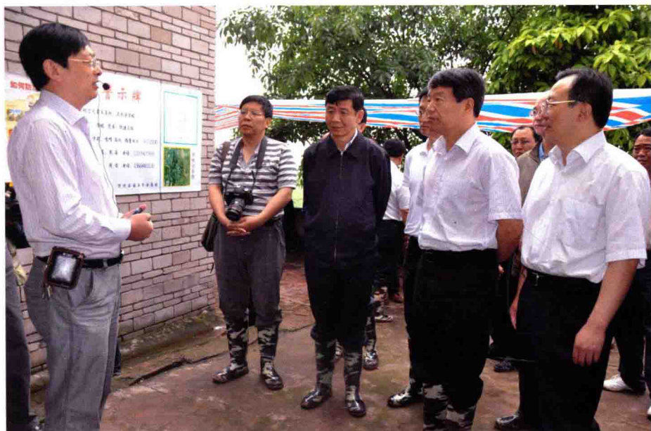
徐绍史部长在三峡库区检查指导工作