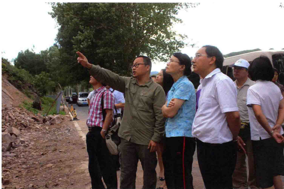
陈小宁副司长在北京延庆检查指导地质灾害防治等工作