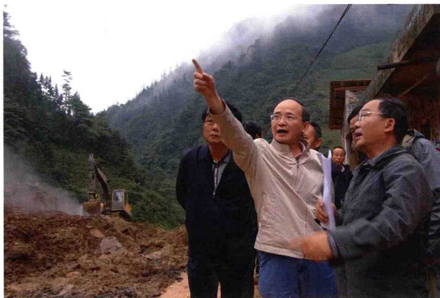
钟自然总工程师在云南彝良田头小学滑坡灾害现场指导应急处置工作