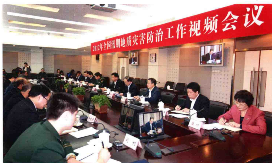
2012年全国汛期地质灾害防治工作视频会议