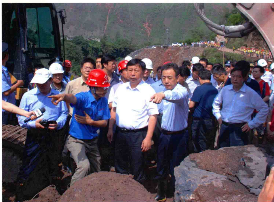
汪民副部长在四川宁南泥石流灾害现场指导应急处置工作