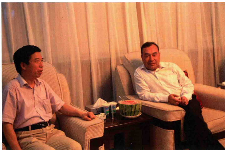
陶庆法副司长带队赴新疆新源滑坡现场指导应急处置工作并与新疆维吾尔自治区 党委常委、副主席库热西·买合苏提商讨地质灾害防治事宜