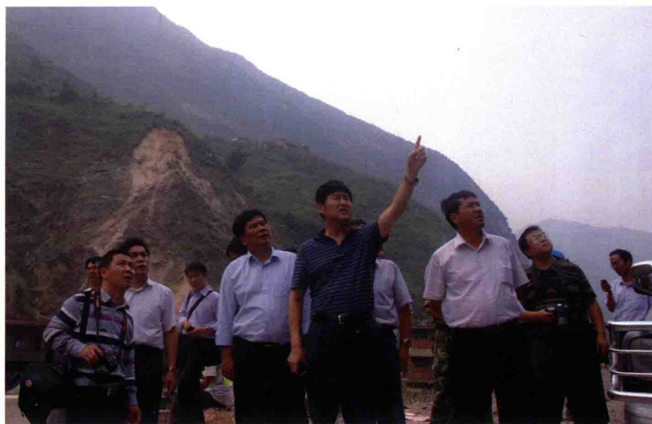
徐德明副部长带队在云南彝良地震灾区指导应急处置工作