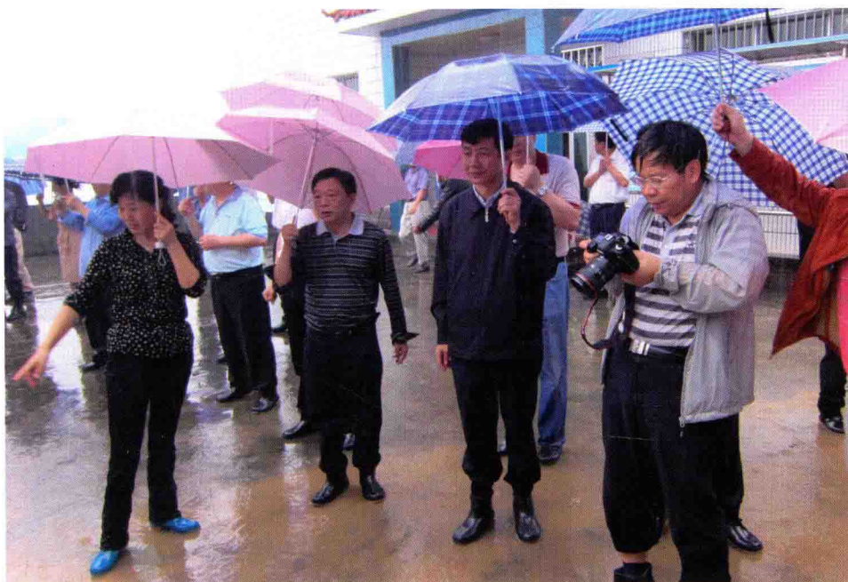
柳源巡视员带队赴湖北五峰检查指导工作