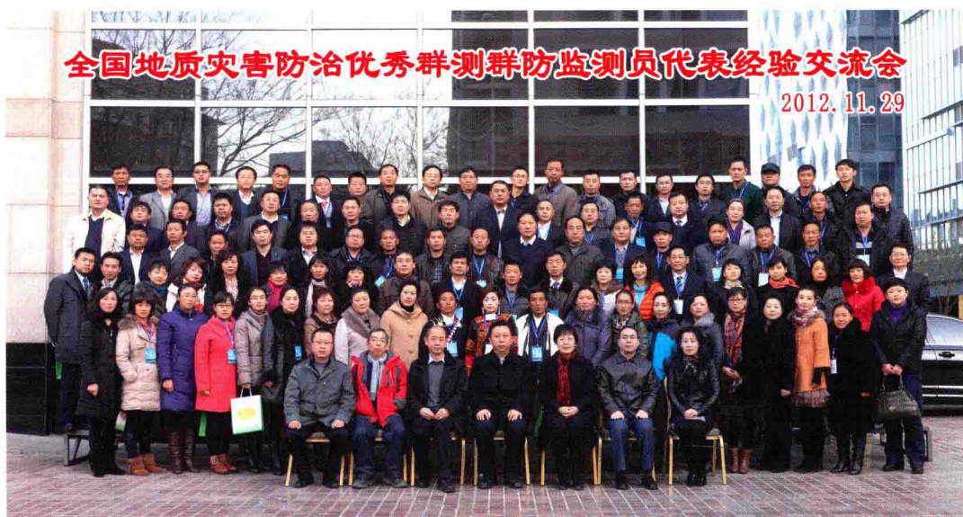
全国地质灾害防治优秀群测群防监测员代表经验交流会