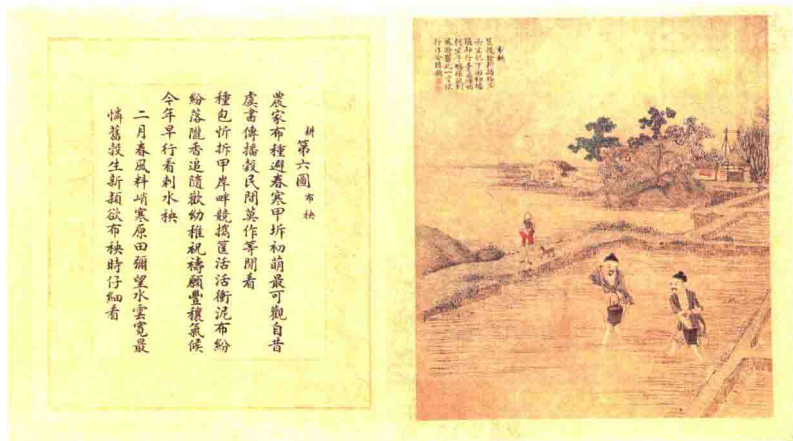
清焦秉贞等绘《康熙御制耕织图》之《布秧》

顿生恻（cè）隐之心，思考如何能减轻农民的劳苦。他精通音律，就派人搜集大量通俗的歌词曲牌，亲自整理修改，创作出很多关于插秧的歌曲，并在农闲时教农民歌唱。