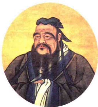
山东曲阜衍圣公府藏明人绘孔子画像