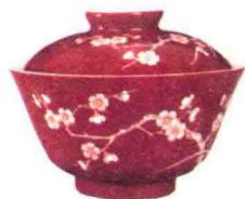
清道光珊瑚红地白梅花纹盖碗