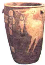
新石器时代 鹤鱼石斧陶缸