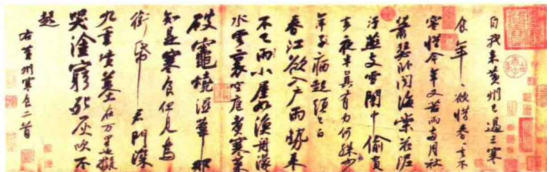
苏轼书法作品《寒食帖》