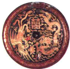
清彩漆双喜龙凤纹镜