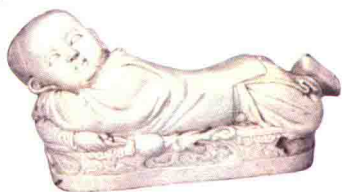
宋定窑白釉孩儿枕