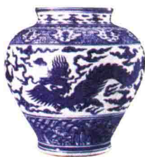
明正统青花云龙纹罐