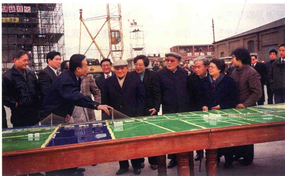
1992年2月7日，邓小平（前左二）、杨尚昆（前右四）同志考察上海杨浦大桥工地，吴邦国介绍有关情况。左四为上海市市长黄菊。

录，向世界展示了浦东开发开放的效率。与此同时，内环线浦东段和罗山路、龙阳路两座立交桥也相继高质量建成；当时位居世界斜拉桥跨度第一的杨浦大桥和第三的南浦大桥，从开工到建成通车分别只用了两年零四个月和近三年的时间。“两桥两路”的建成，逐步使黄浦江两岸在地理和思想观念上融为一体，浦东成为人们向往的热土。