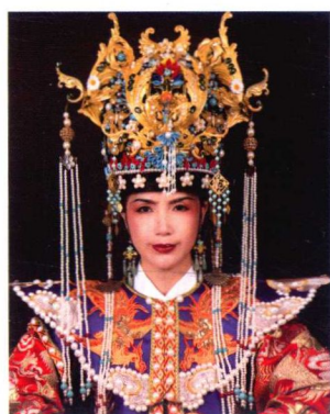
明代诰命夫人妆容造型 146