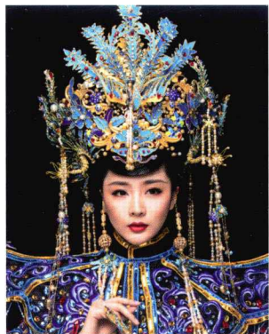
清朝皇后朝冠妆容造型 182