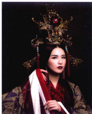
先秦王后妆容造型