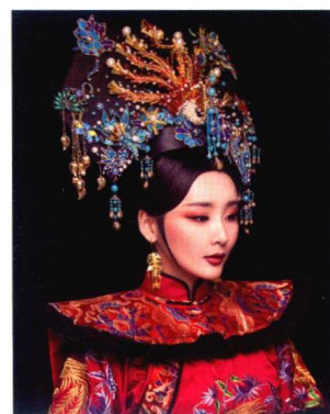
清朝妃子妩媚感大拉翅妆容造型 176