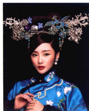
清朝妃子端庄感大拉翅妆容造型 170