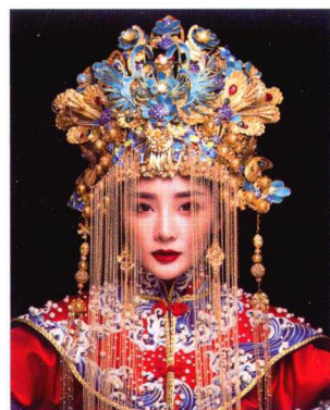
凤冠霞帔婚服妆容造型 204