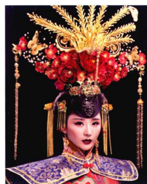
清朝妃子流苏大拉翅造型 167