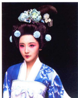
仕女堕髻妆容造型