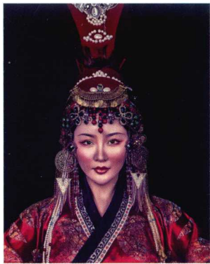
元代罽冠妆容造型