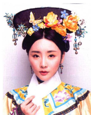
清朝妃子一字头妆容造型 156