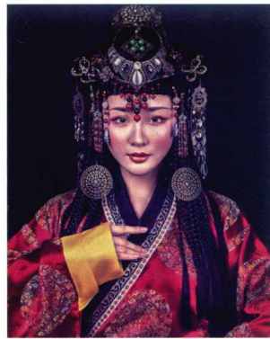
元代少女发髻造型