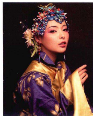
清末民初缠头妆容造型