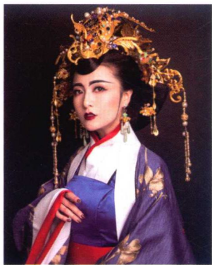
秦汉皇后金冠造型