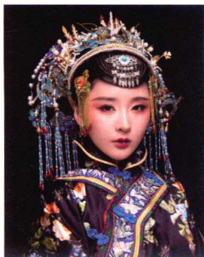
清末民初钿子造型