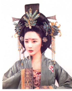
国夫人高髻妆容造型