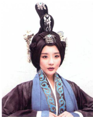
秦汉素雅高髻妆容造型