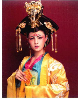
贵妃宝髻妆容造型