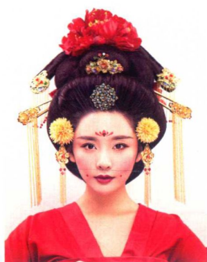
贵妇插花高髻造型