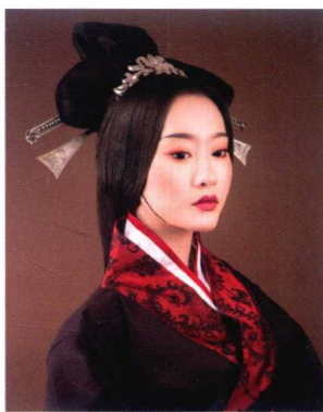
秦汉后妃妆容造型