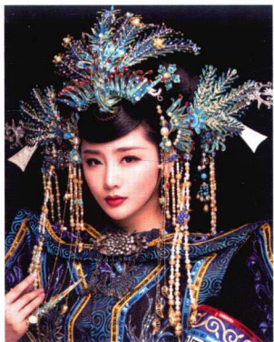
清朝皇后点翠流苏旗头造型 186