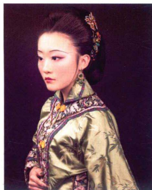
清末民初民妇妆容造型