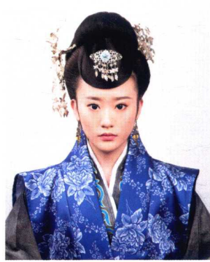
宋代民妇盘髻造型