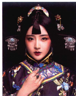
清末民初女子妆容造型 211