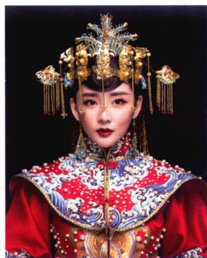
流苏高髻婚服造型 208