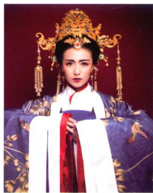
秦汉皇后花钗髻妆容造型