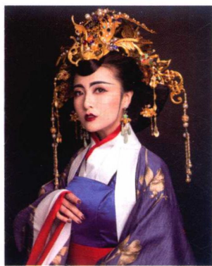
秦汉皇后金冠造型