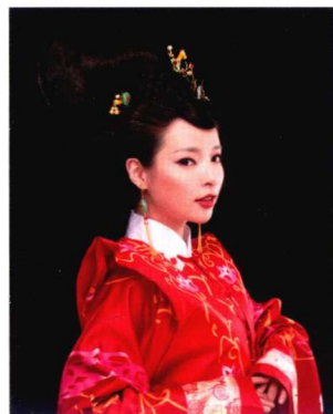
明代点翠高髻婚服造型 143