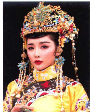
清朝皇后流苏钿子造型 194