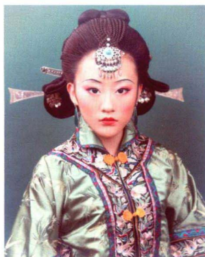
清末民初女子后盘发髻造型