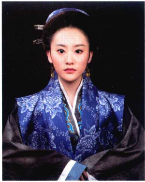
宋代民妇妆容造型