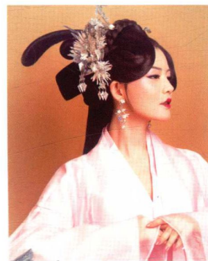
仕女望仙髻妆容造型