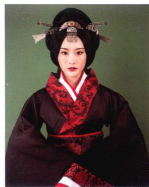
秦汉贵妇椎髻造型