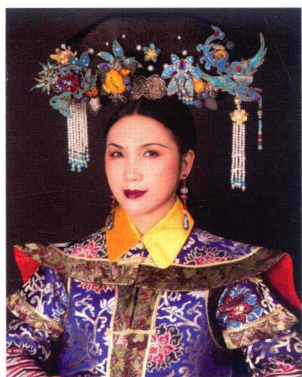
清朝太后点翠旗头造型 200