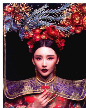
清朝妃子大拉翅妆容造型 163