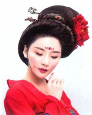
贵妇抛家髻妆容造型