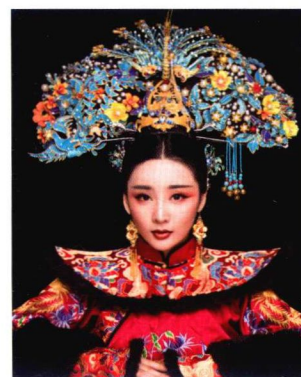
清朝妃子奢华大拉翅造型 179