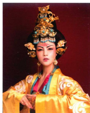
贵妃两髻抱面造型