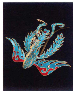
真羽仿点翠三尾凤制作