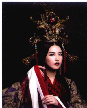
先秦王后妆容造型