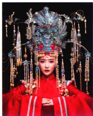
明代流苏点翠朝冠婚服妆容造型 132