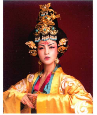
贵妃两鬓抱面造型