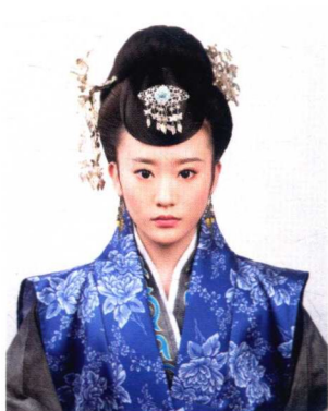
宋代民妇盘髻造型