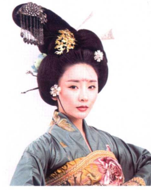
国夫人半翻髻造型