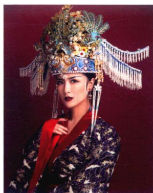
宋代皇后珍珠花钿妆容造型