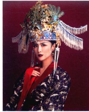
宋代皇后珍珠花钿妆容造型