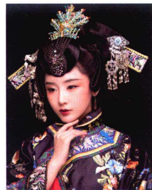
清末民初贵妇造型 216