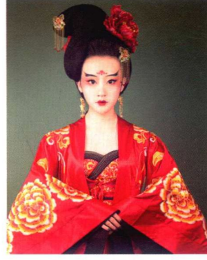
贵妃堕马髻妆容造型