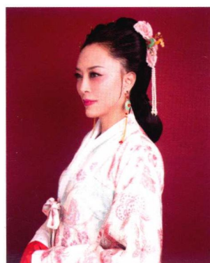
明代民妇妆容造型 151