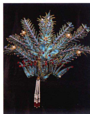
真羽仿点翠金丝凤制作