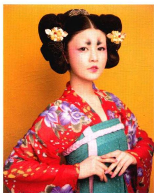
仕女丫髻妆容造型