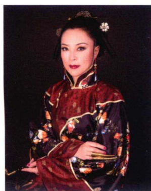
清末民初中老年女子后盘髻造型