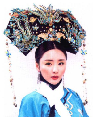
清朝妃子点翠大拉翅造型 174