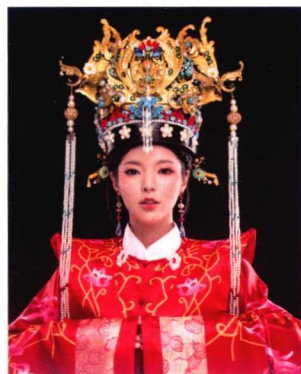
明代凤冠婚服妆容造型 139