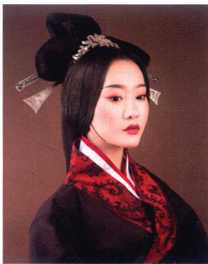
秦汉后妃妆容造型