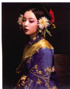
清末民初簪花发髻造型