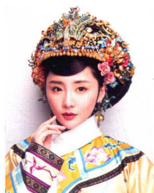
清朝妃子钿子造型 160