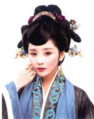
秦汉反馆高髻造型