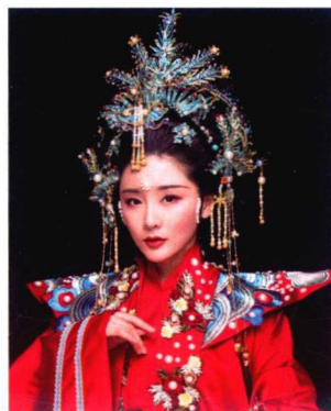
明代点翠高髻婚服造型 137