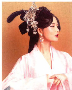
仕女望仙髻妆容造型