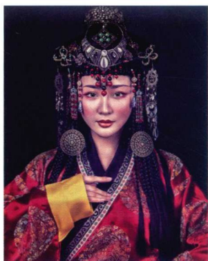
元代少女发髻造型