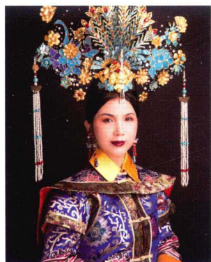
清朝太后大拉翅妆容造型 197