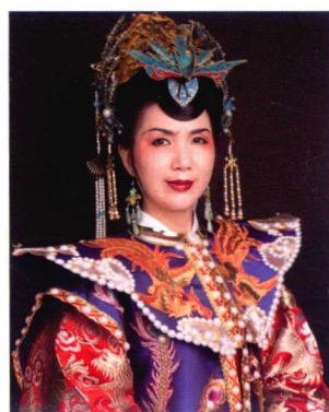
明代诰命夫人高髻造型 149