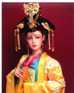
贵妃宝髻妆容造型