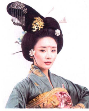
国夫人半翻髻造型