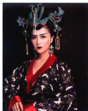
宋代皇后高髻造型