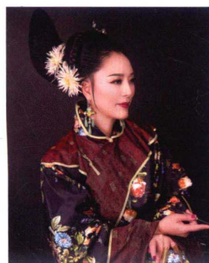
清末民初中老年女子妆容造型