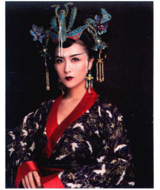
宋代皇后高髻造型