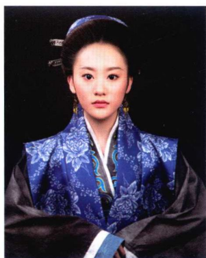
宋代民妇妆容造型