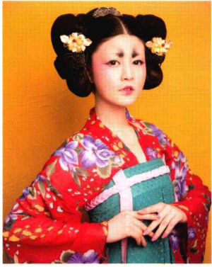
仕女丫髻妆容造型