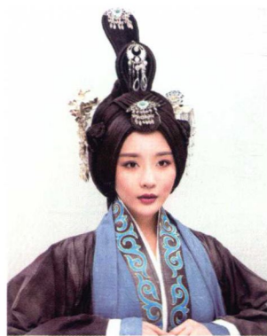
秦汉素雅高髻妆容造型