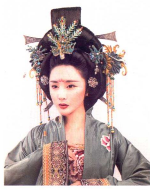
国夫人高髻妆容造型