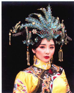
清朝皇后点翠凤凰旗头妆容造型 189