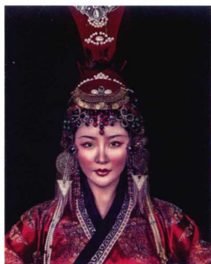
元代罽罽冠妆容造型