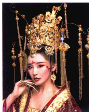
皇后冠冕妆容造型