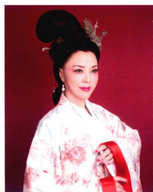
明代民妇高髻造型 154