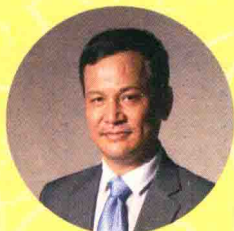
刘丹青 中国社会科学院语言研 究所所长