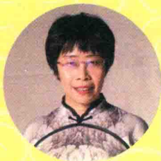
蒙 曼 中国社会科学院语言研究 所研究员、博士生导师