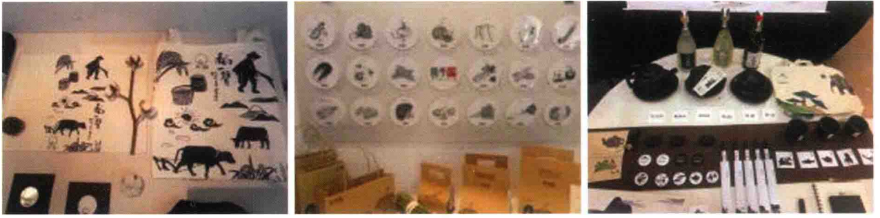
具有农业大学学科特色的设计作品二