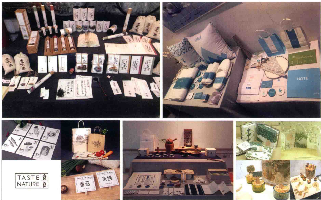
品牌设计团队的作品（学生设计）

品牌设计教学团队是视觉传达设计专业的优势教学平台，在教学与实践中已积累了丰富的成果。品牌设计教学立足高起点，追求高水平，进一步优化人才培养方案，将素质教育、能力培养和知识传播作为一个整体，贯穿于整个视觉传达设计专业的人才培养过程之中。团队积极组织教学调研，结合华南地区创意产业需求特点，积极引进先进的教育理念和办法，通过整合学科资源，提升品牌设计教学平台，制订出培养以图形创意、字体设计、版式设计、品牌设计等为核心的专业教学体系。团队结合社会、企业对品牌的要求进行研究与实践，在专业核心期刊发表论文《户外广告创意塑造城市品牌新形象》《浅析日本街头文化品牌 Evisu 中的传统语》等。完成与企业合作的 11 项横向课题，如森度生态农业品牌设计等。