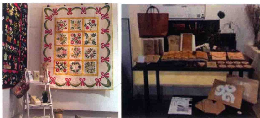
具有农业大学学科特色的设计作品一

此部分教学内容在包装设计、图形创意、视觉形象设计、中国传统图案、版式设计、字体设计等课程中具体实施。