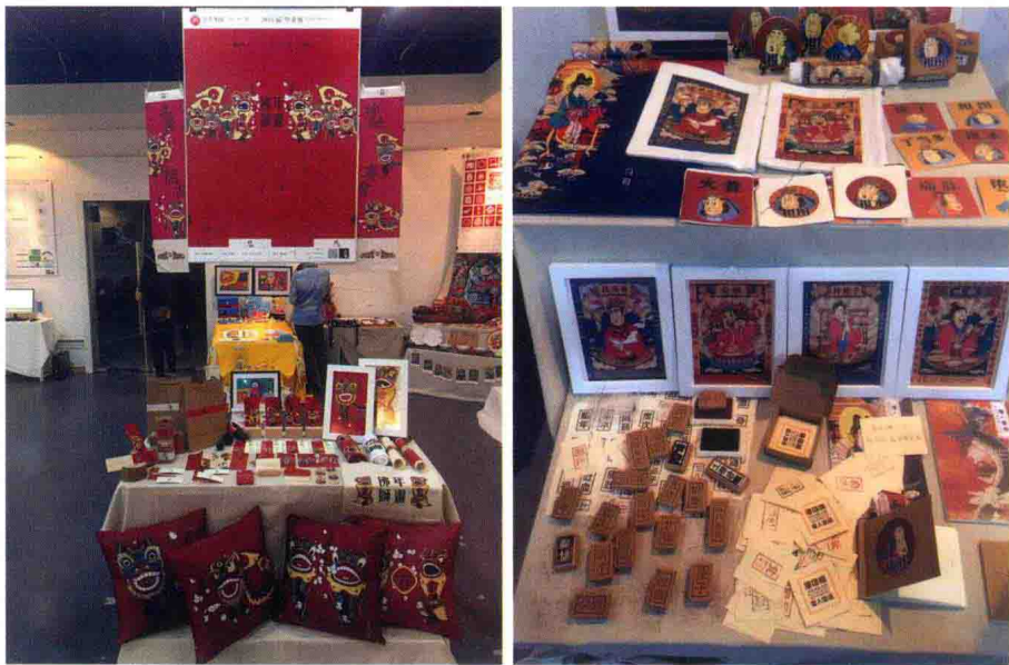
具有岭南地域特色的设计作品一

此部分教学内容在广告设计、包装设计、图形创意、视觉形象设计、中国传统图案、版式设计、字体设计等课程中具体实施。