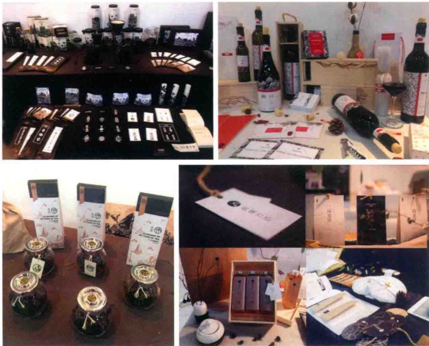
包装设计团队的作品（学生设计）