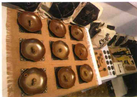
具有传统文化设计理念的作品一

此部分教学内容在图形创意、中国传统图案、书籍设计、字体设计、平面设计理论等课程中具体实施。