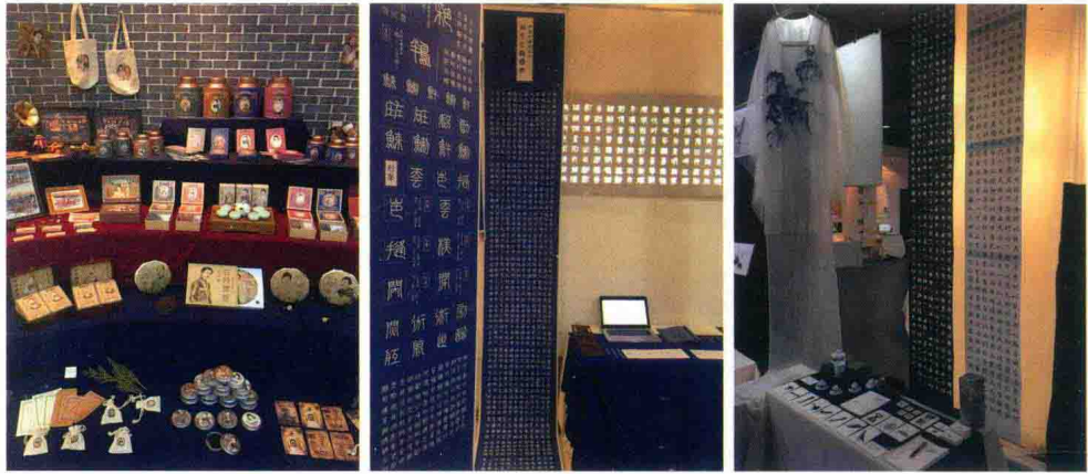
具有传统文化设计理念的作品二