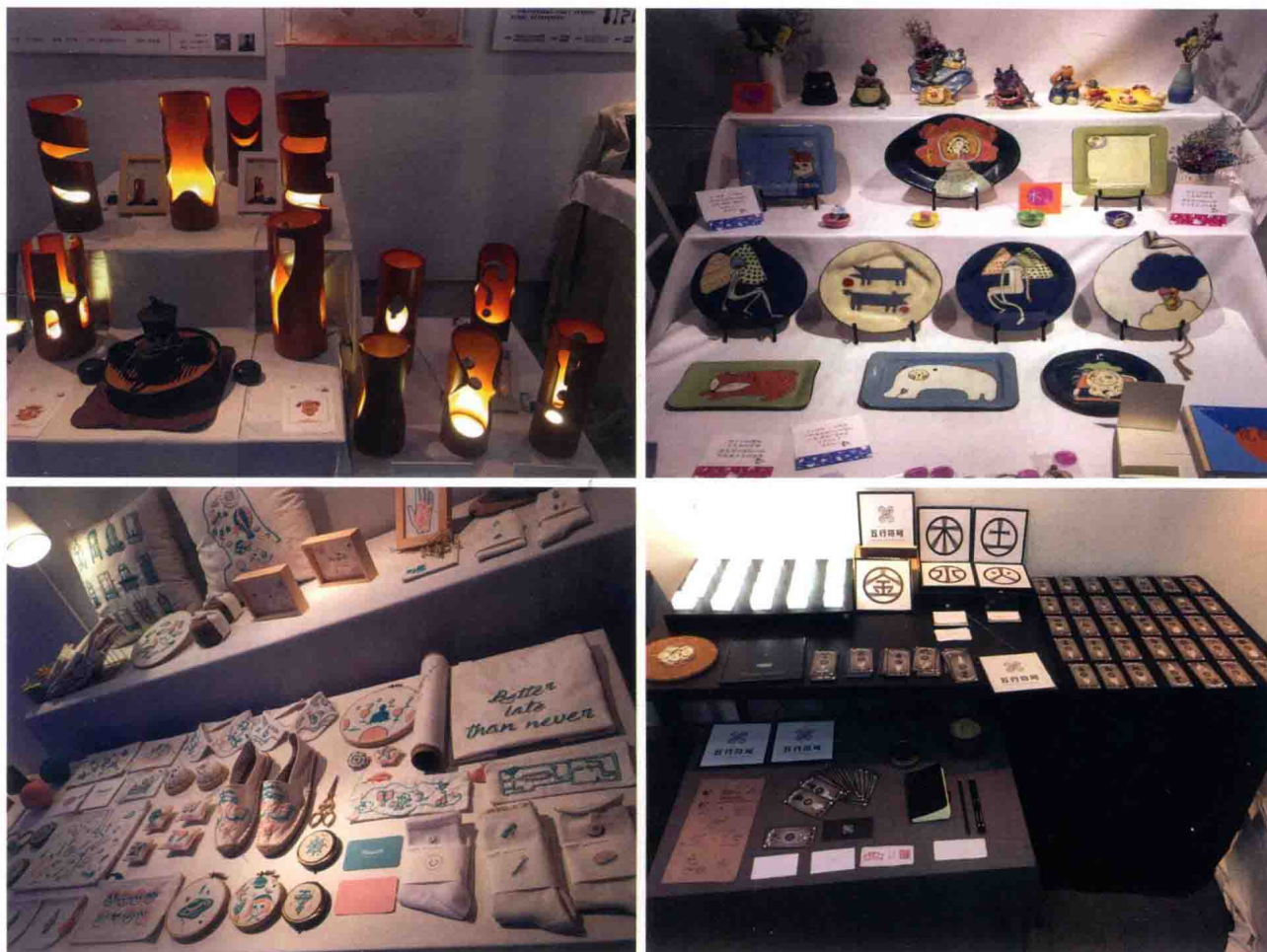
具有岭南地域特色的设计作品二