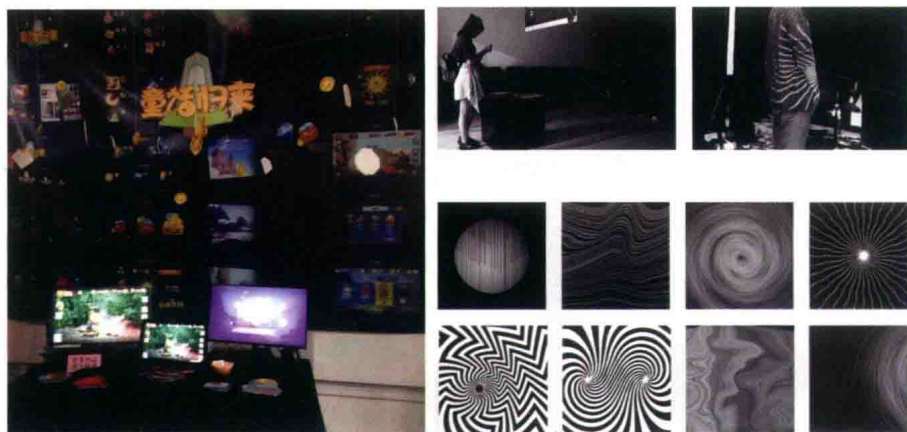
动态设计团队的作品（学生设计）

团队拓展与其他学科的优势互补，如与信息学院的相关学科结合，提高学生的技术手段，培养学生的跨界设计能力。在信息视觉传播中，对其他学科的建设及成果转化进行优化，如农产品的信息编辑与网页设计、数字信息导向设计等。团队成员积极探讨视觉传达设计专业数字动态设计的教学研究，承担了教育部人文社科课题《动态抽象元素在现代信息传播中的语境研究》。论文《视觉嬗变——抽象元素四维形态的衍生与拓展》《关于 Flash 互动广告中鼠标交互的情感设计》《鼠标交互行为下的网络互动视觉设计》均在核心期刊发表。