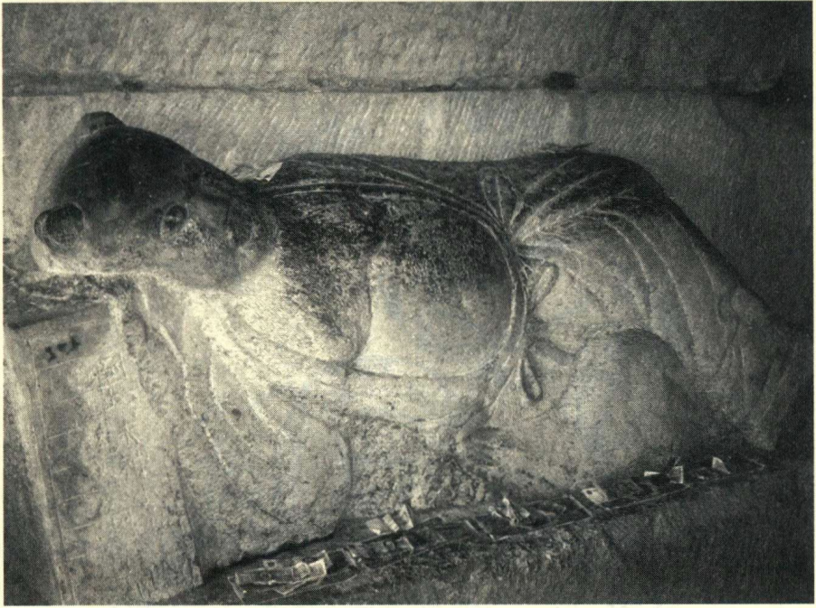
雲門山萬春洞陳搏臥像