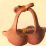
比基尼 (上) 129