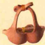
比基尼 (上) 129