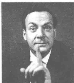
美国著名物理学家费曼。

现在，我们从 19 世纪末和 20 世纪初德国一位伟大的物理学家普朗克，以及他如何克服热辐射中出现的困难而引出量子论讲起。