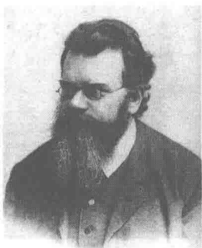
奥地利物理学家玻尔兹曼。

开尔文更是沮丧地说：“在我看来，第一朵‘乌云’恐怕是非常浓厚的呢。”直到爱因斯坦于1905年提出狭义相对论后，这一朵乌云才消散开来，阳光明媚。这方面的详细情况与本书关系不太大，不作详述。