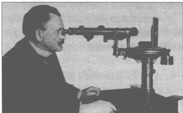
美国物理学家迈克尔逊正在观察“以太飘移”。

1852—1931, 1907 年 获得诺贝尔物理学奖) 在克里夫兰召开的一 次会议上说:“无论如 何,可以肯定,光学比 较重要的事实和定律, 以及光学应用比较有 名的途径,现在已经了 如指掌,光学未来研究 和发展的动因已经荡 然无存。”