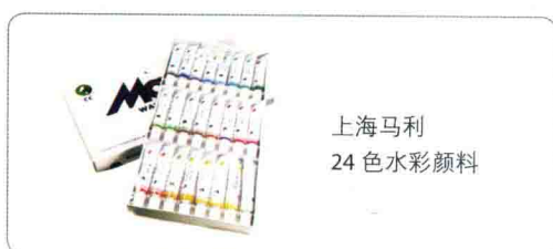
上海马利 24 色水彩颜料