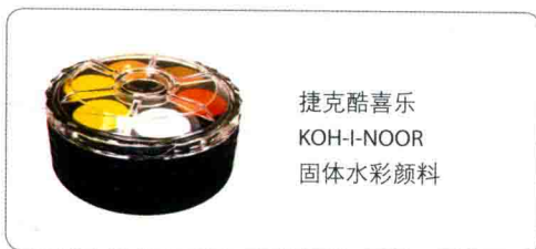
捷克酷喜乐 KOH-I-NOOR 固体水彩颜料

我们可以购买的水彩颜料品牌非常多，但是无论哪种，都可以配合着使用，如果刚开始画就购买颜色数量较多的颜料，很容易把颜色混淆，而且有些颜色暂时不一定能用到。本书中建议初学者使用 24 色的颜料。