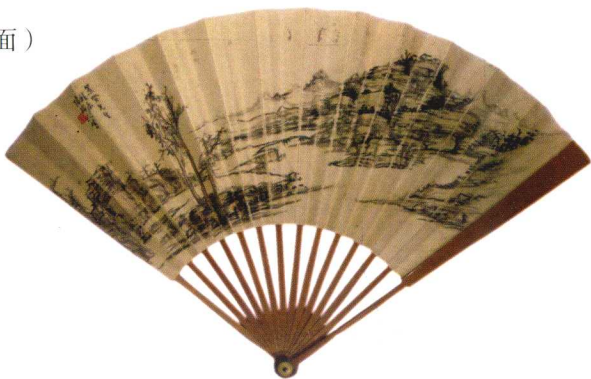
胡適題書、陳樹人繪畫扇面（背面）