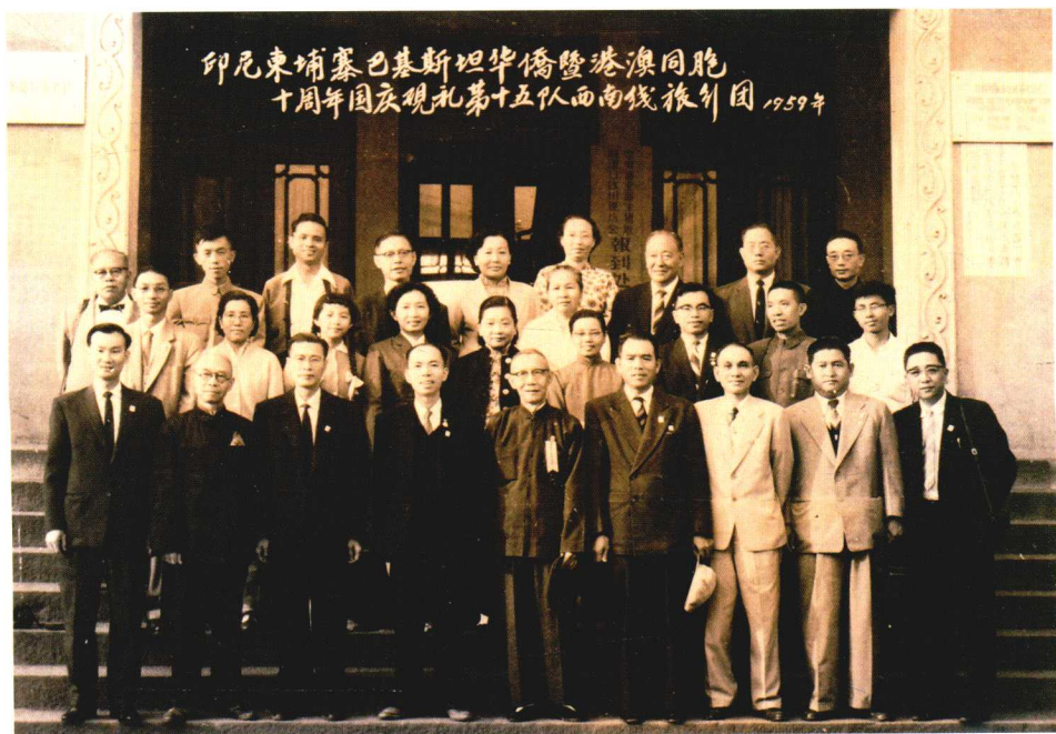
一九五九年印尼東埔寨巴基斯坦華僑暨港澳同胞十周年國慶觀禮第十五隊西南綫旅行團合影