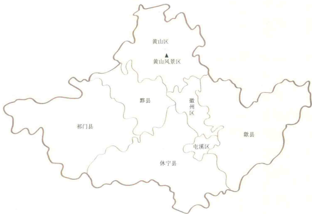
0-1 黄山市屯溪区行政区划示意图

1949年5月13日设立屯溪市，下设高阳、隆新、阳湖、率口四乡。此后行政机构和区划几经变动。1987年11月，设立地级黄山市，撤销屯溪市，改设黄山市屯溪区，形成目前区界。2005年，全区辖屯光、黎阳、阳湖、奕棋、新潭5镇和昱东、昱中、昱西、老街4个街道办事处，36个村247个村民小组，30个社区508个居民小组，总人口约16万人。