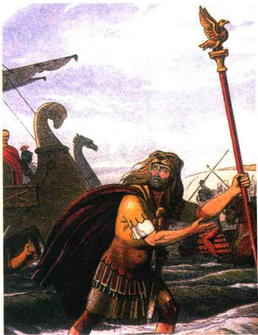
▲ 恺撒率军登陆不列颠

从公元前8世纪开始,欧洲大陆上的凯尔特人开始向不列颠岛迁移,这些移民带来了冶铁技术,引进了金属货币,建立了王国,设立了祭司制度。当时来到不列颠岛的凯尔特人前后共有三批,迁徙过程历时五六百年,最早一批是来自莱茵地区的凯尔特人。大约在公元前500年,第二批凯尔特人又迁徙到不列颠岛,统称布立吞人(Britons),他们依靠强大的武力占领了今天的英格兰地区。此后的几百年里,不列颠岛成为“布立吞人之地”,不列颠(Britain)一词也由此而来。大约在公元前100年,第三批凯尔特人从高卢北部迁入,他们被称为“比尔盖人”。随着他们的到来,不列颠岛开始出现国家,其中较大的有泰晤士河北岸的卡图维拉尼王国,东南部的科利达尼王国,以及苏塞克斯地区的科米乌斯王国。由于比尔盖人曾经协助高卢人反抗罗马人的入侵,这也成为后来罗马人进攻不列颠的借口。