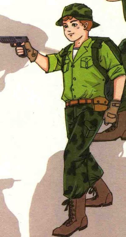
机智灵活的 黑蓝虎