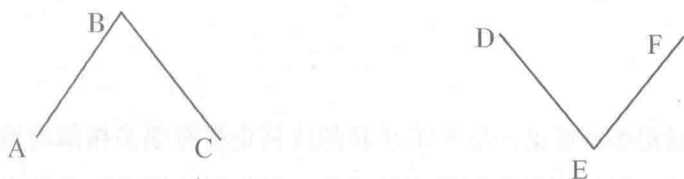
图 1-1 V 图形态

C. V 图转换，股价反转：V 图转换以后，股价运行趋势开始逆转，价格在反方向运行空间放大。反转走势中，V 图形态规模扩大，短线 V 图的价格转换成为投资者中长期交易的形态基础。