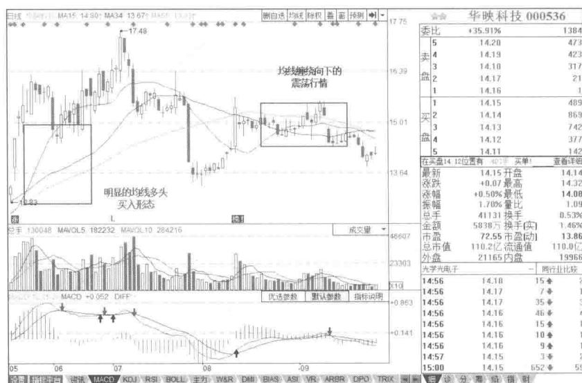
图1-1 华映科技一日线图

华映科技（000536）在 2016 年 5 月底至 6 月中旬期间，明显处于均线多头趋势，因为其 135 均线交易系统中，3 条均线都是向上排列的。此时，投资者可以选择做多操作。而到了 8 月中旬及 9 月中旬期间，135 均线交易系统中的 3 条均线明显处于缠绕并向下的状态，表明是震荡走低的趋势。此时，投资者应观望。使用 135 均线交易系统观察情况，行情一目了然。如图 1-1 所示。