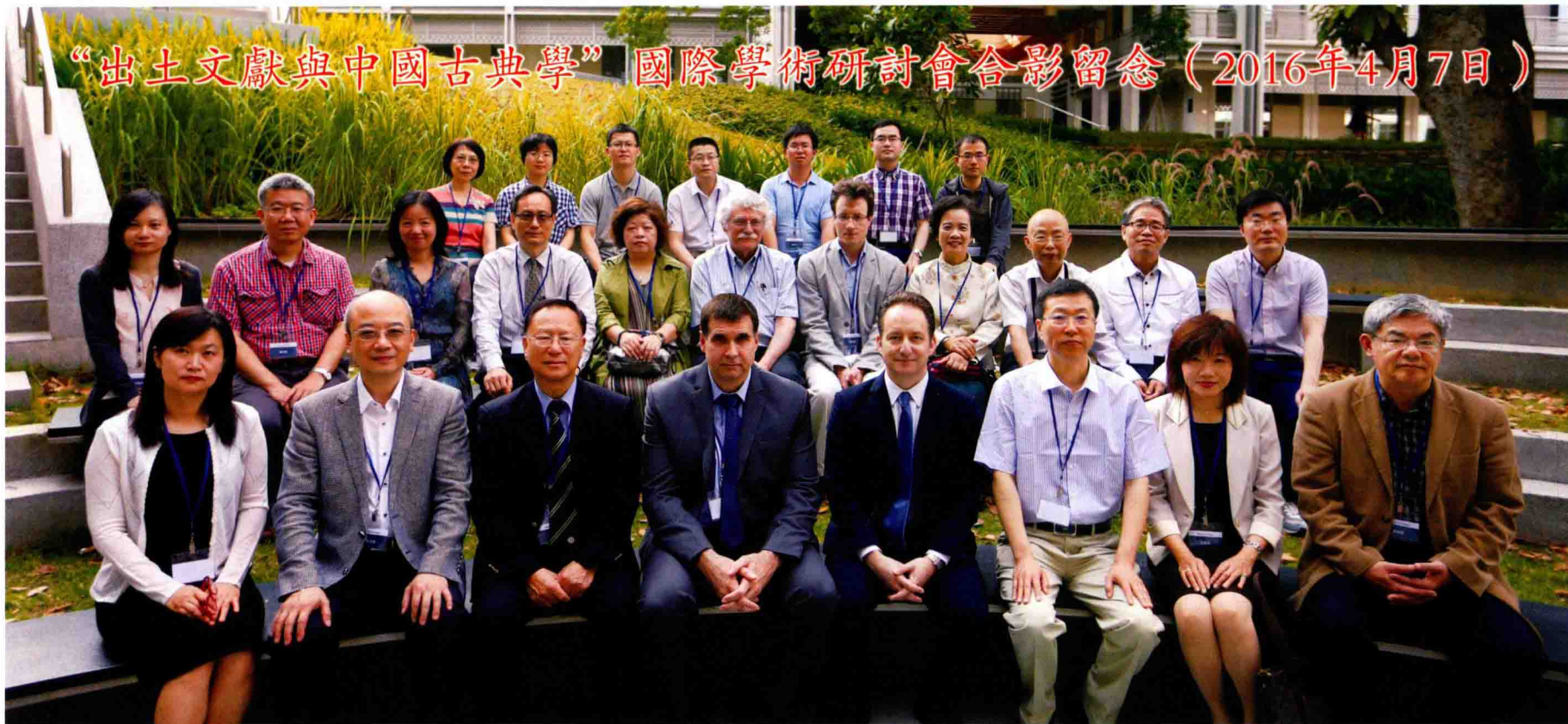
全體與會學者合影