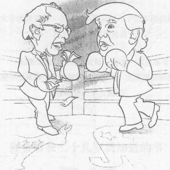
美国参议员 伯尼·桑德斯