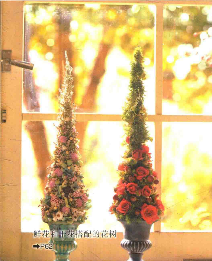
鲜花和干花搭配的花树