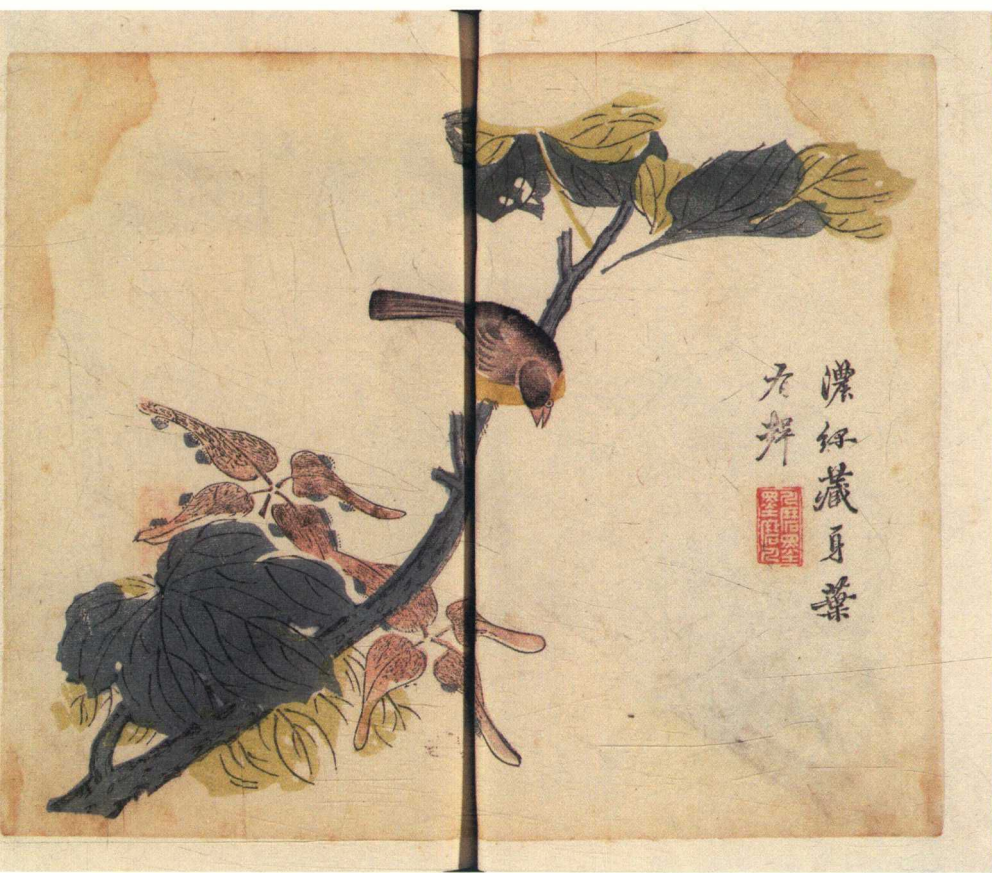
芥子园画传三集二种卷末一卷 / (清)沈心友辑 (清)王安节等绘 清嘉庆间芥子园刻本