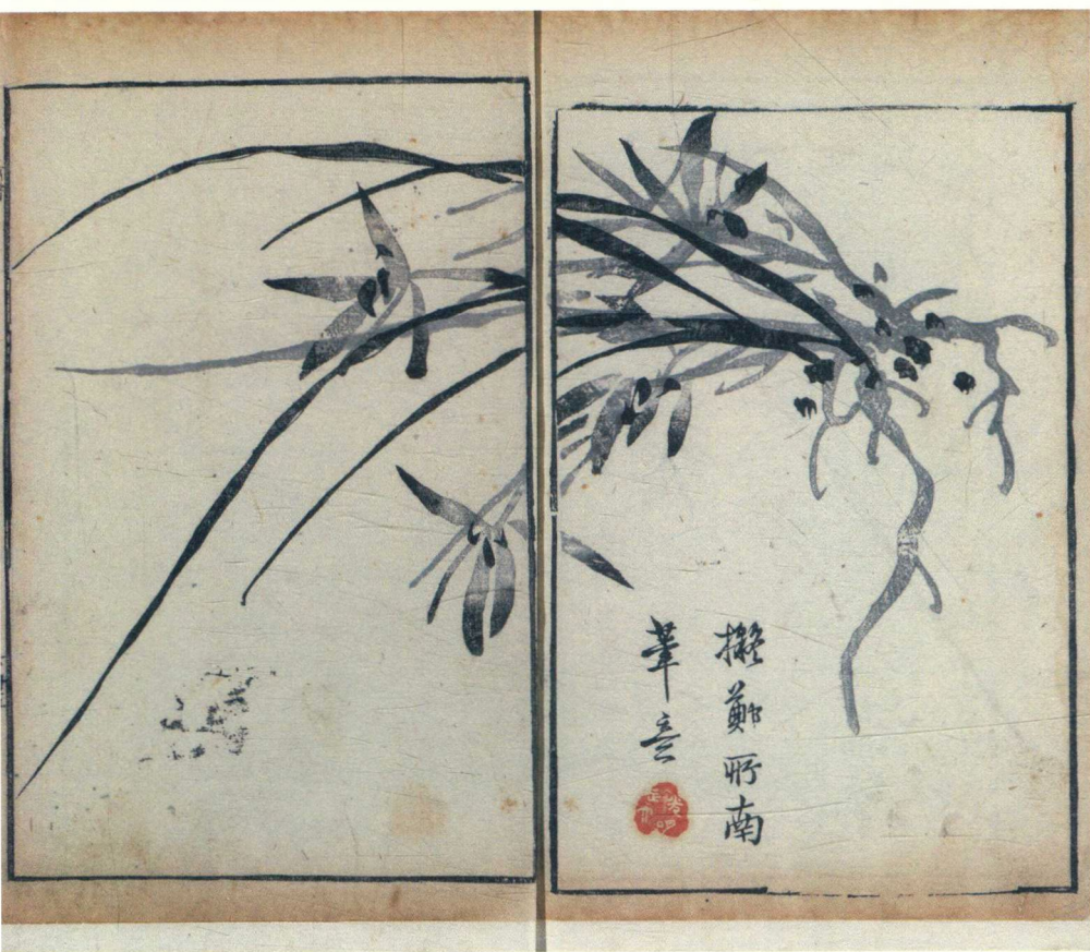
芥子园画传二集四种卷首一卷 / (清) 沈心友辑 (清) 王质 (清) 诸升绘 (清) 王安节等编 清嘉庆二十二年 (1817) 芥子园焕记刻本