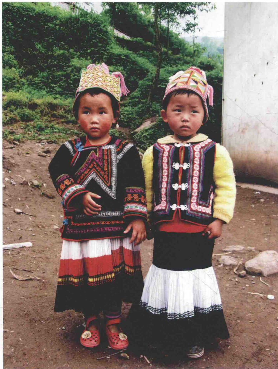
穿童裙的彝族小朋友