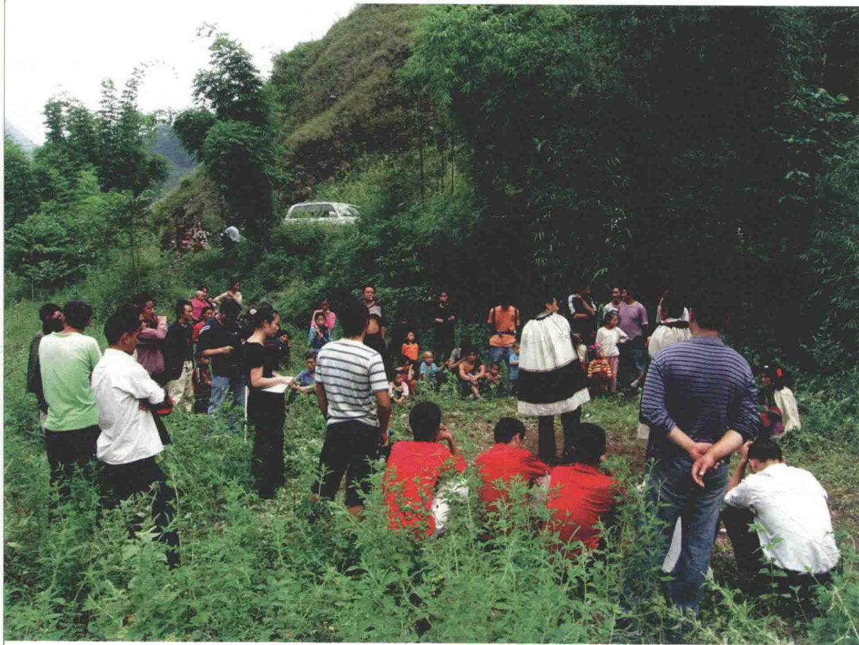
彝族民歌采风现场