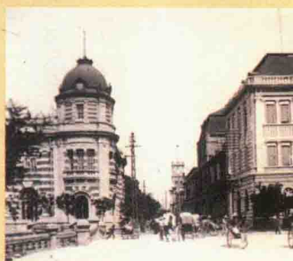
↑东交民巷旧照 图为民国时东交民巷街的照片。

东交民巷，是北京市东城区的一条胡同，旧时因这里是漕运地，所以被称为“东江米巷”。胡同西起天安门广场东路，东至崇文门内大街，全长1500多米，是老北京最长的一条胡同。1860年第二次鸦片战争后，欧美诸国与日本的公使馆陆续选择东交民巷一带作为外交馆址。《辛丑条约》签订后，划东交民巷为使馆界，各国除了扩建使馆外，还设立邮局、银行、饭店、官司邸等机构。这段历史让此区留下许多风格各异的西洋建筑。