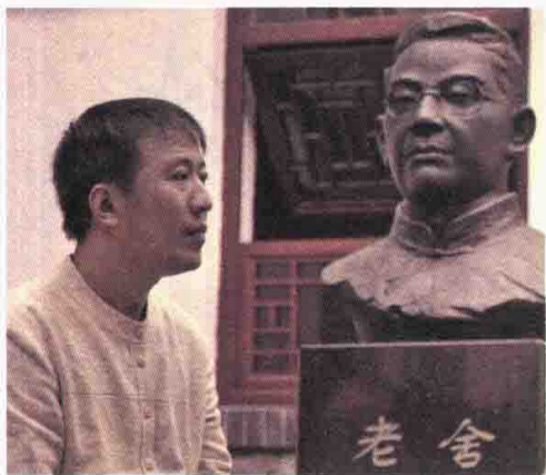
魏新，文化学者，全国青联常委， 央视《百家讲坛》主讲人。