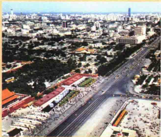
↑东长安街旧照 学生队伍踏上东长安街，高喊口号走向赵家楼曹宅。

学生被巡警阻拦后，北转经户部街，东行，经富贵街、东户部街、东三座门大街，跨御河桥，沿东长安街经东单牌楼，往北走米市大街，进石大人胡同，穿过南小街进大羊宜宾胡同，最后至前赵家楼胡同西口，往东至曹宅。