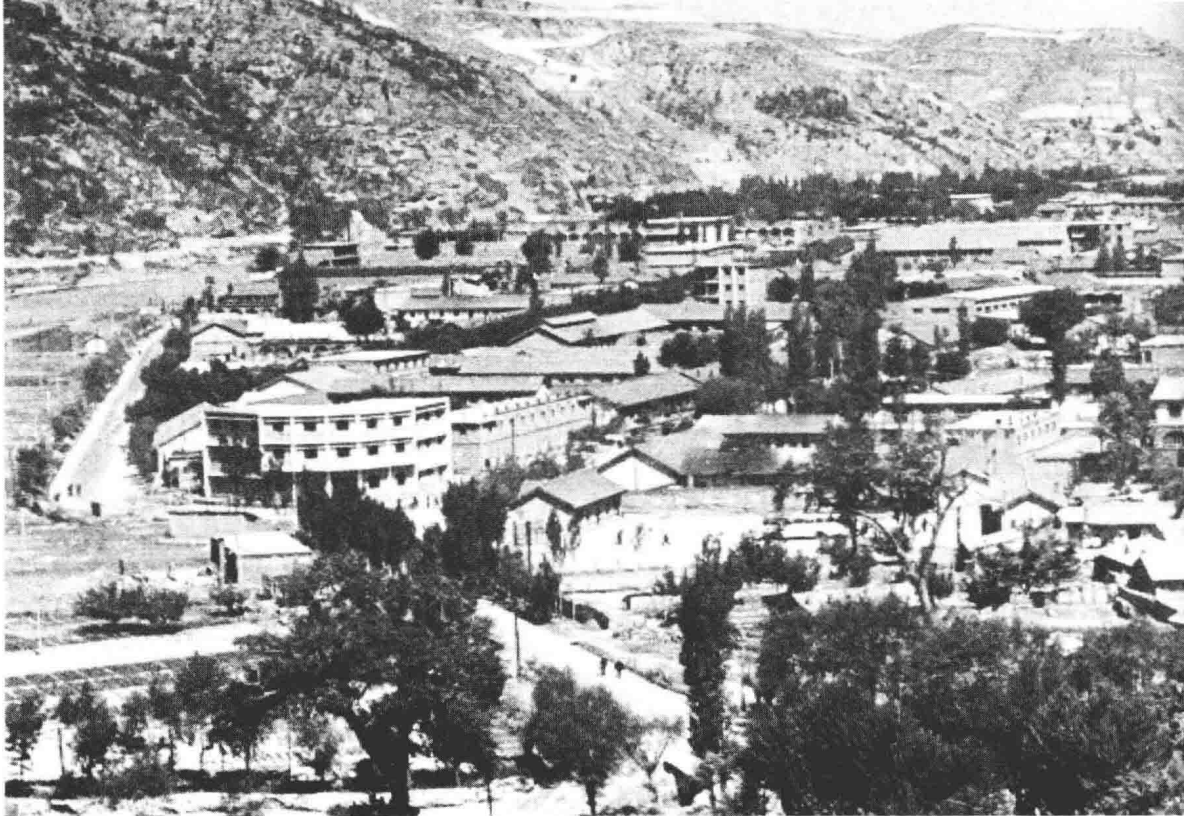
保安县城旧照 (1970年代拍摄)

的志丹县金汤镇小学堂，一九九四年八月中共中央军委确定为中国人民解放军建军以来的三十六位军事家之一。