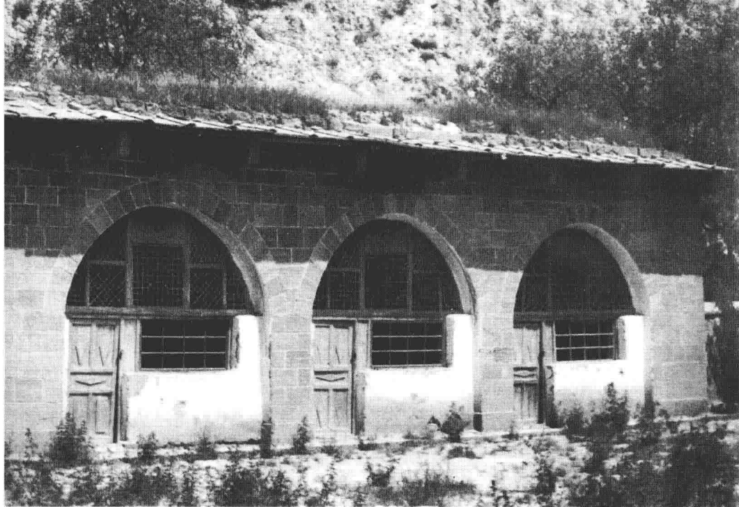
志丹县金汤镇小学堂