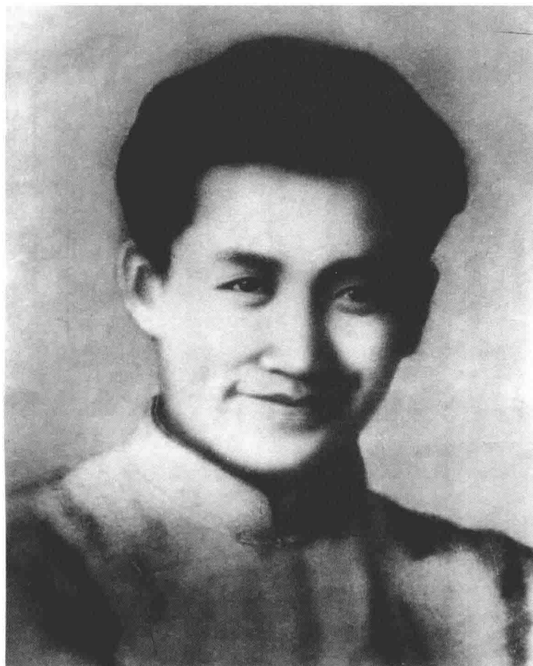
刘志丹 ( 1903—1936 )