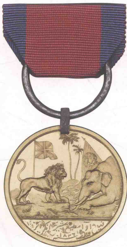
▲东印度公司颁发的金质缅甸奖章。

除围攻塞林伽巴丹奖章外，在随后几十年中，随着征战范围的扩大，东印度公司又陆续设立了多种战役奖章，包括：埃及1801奖章（Medal for Egypt 1801）、占领锡兰奖章（Capture of Ceylon Medal）、尼泊尔奖章（Medal for Nepaul）、缅甸奖章（Medal for Burma）、坎大哈—加兹尼—喀布尔奖章（Candahar, Ghuznee, Cabul Medal）、贾拉拉巴德奖章（Jellalabad Medal）、防卫卡拉特—吉勒宰堡奖章（Medal for the Defence of Kelat-i-Ghilzie）、信德奖章（Scinde Medal）、瓜廖尔之星奖章（Gwalior Star）、古尔格奖章（Goorg Medal）等。