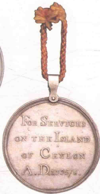
▲ 东印度公司颁发的占领锡兰奖章。