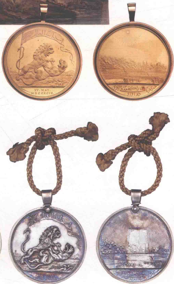
▲ 东印度公司颁发的金质（右上）、银镀金（左）、银质（右）塞林伽巴丹奖章。

战后，东印度公司于1801年设立了围攻塞林伽巴丹奖章，章体为圆形，但直径不一，从45毫米到48毫米不等。此时的奖章仍没有正式的绶带，仅用黄色或者红色的绳子串起。值得注意的是，该奖章分为五个等级，其中金质奖章发给最高级指挥官，