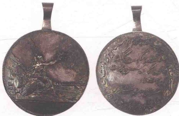
▲ 东印度公司颁发的德干奖章。