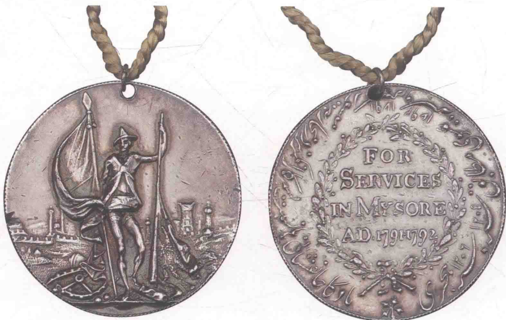
▶ 东印度公司颁发的迈索尔奖章。