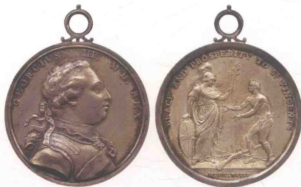
▲ 非常罕见的加勒比战争奖章。

战后，英国政府设立“路易斯堡战役奖章”，颁发给在战争中表现勇敢的军人。该奖章直径42毫米，分为金银铜三种等级，由于发放数量极为有限，故后世留存下来的很少。