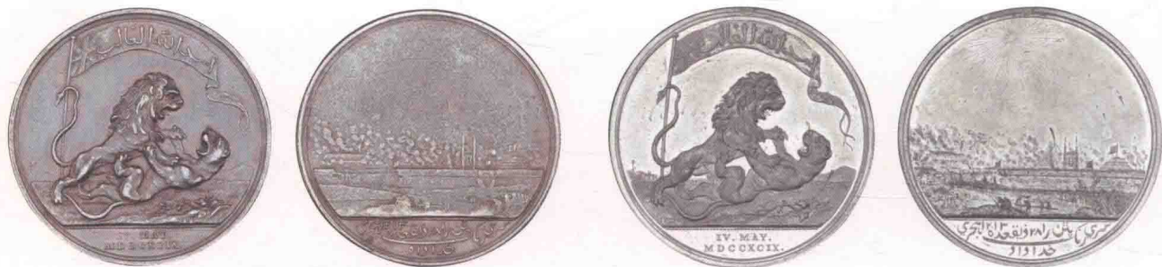
▲东印度公司颁发的青铜(左)、锡质(右)塞林伽巴丹奖章。

银镀金、银和青铜质的发给中级职位的人，而锡质的则发给那些被列为较低级别的军人。如此多的级别，也从侧面反映了当时英国军队中等级森严的特点。据资料显示，当时铸造奖章总数超过50000枚，其中金质350枚、银镀金质185枚、银质850枚、青铜质5000枚、锡质45000枚。