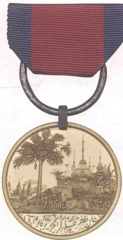
▲东印度公司颁发的银质镀金缅甸奖章。