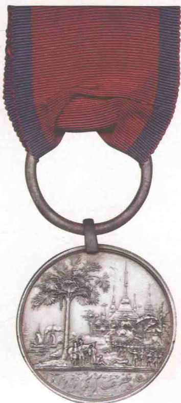
▲ 东印度公司颁发的银质缅甸奖章。