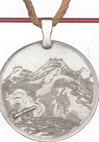
▲ 东印度公司颁发的尼泊尔奖章。