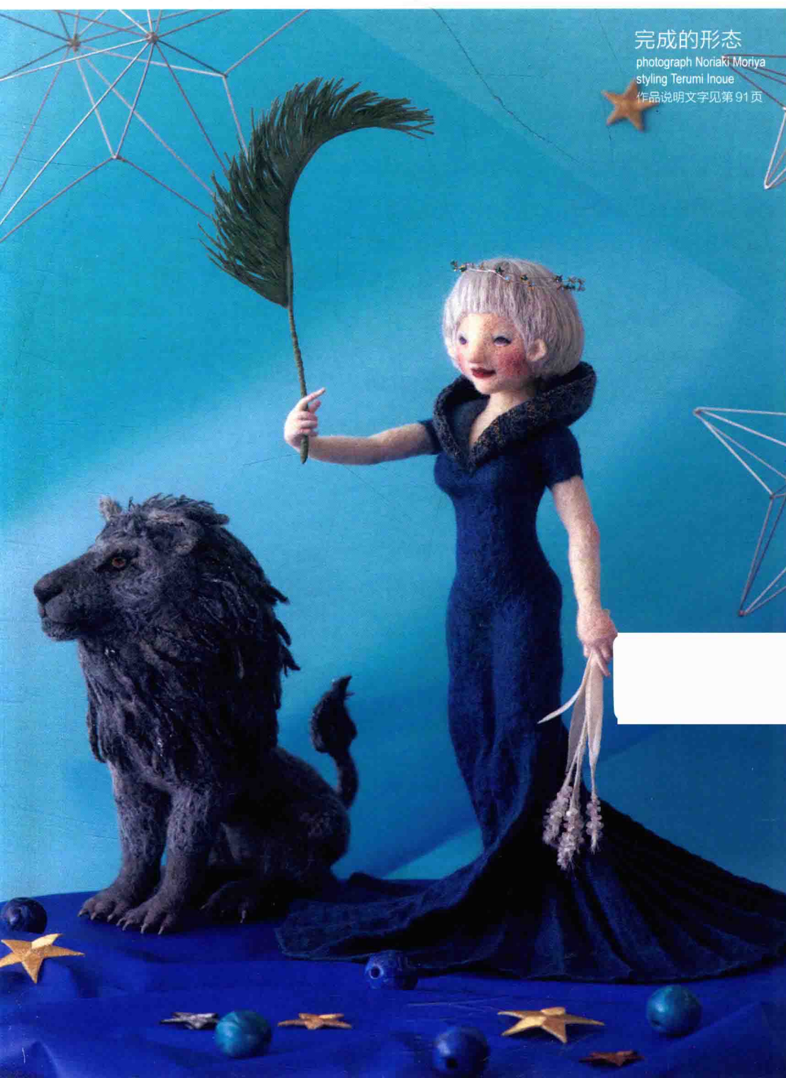
完成的形态 styling Terumi Inoue 作品说明文字见第91页