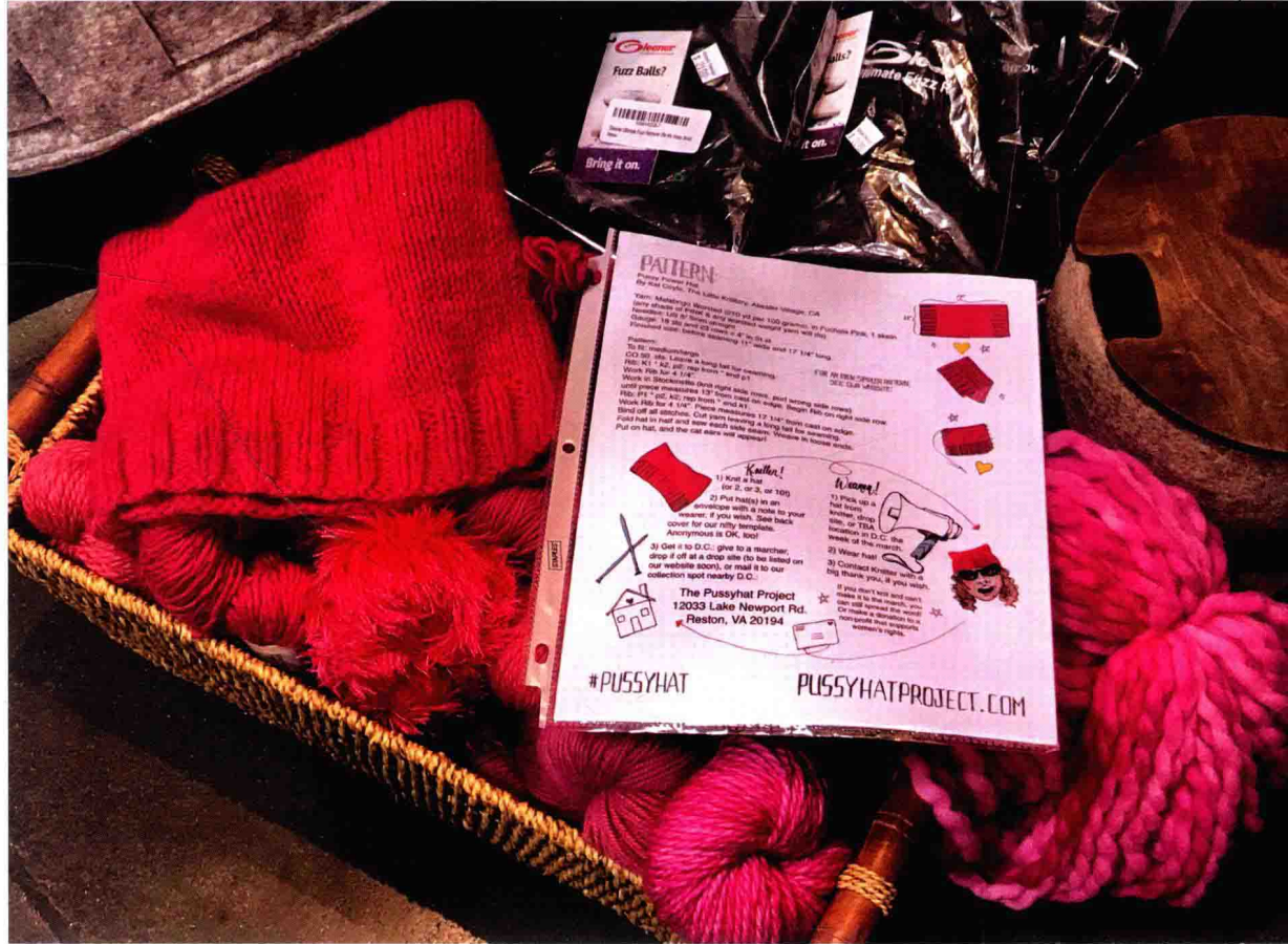
提供给猫耳帽运动的粉色毛线和编织图。1团粗毛线(100g)即可完成

2月末,加利福尼亚州的圣克拉拉举办了“Stitches West”编织大会。会场上,猫耳帽的编织图和毛线材料包非常受欢迎。还有热心的编织者编织了数顶帽子,捐赠给华盛顿哥伦比亚特区用来参加下次的抗议活动。“我住得很远,没法直接参加华盛顿的抗议活动,就将自己的心意编织成了帽子,请一定用上它。”那位女子还写了这样一张卡片。和粉色的猫耳帽放在一起的卡片,传递了编织者和戴着帽子游行者的心意。我本