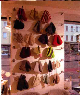
上/店内随处可见色彩缤纷的毛线 下/墙上挂着应季的编织小物。这个季节主要是帽子,挂在那里很好看

www.snurre.fi www.facebook.com/snurrelankakauppa