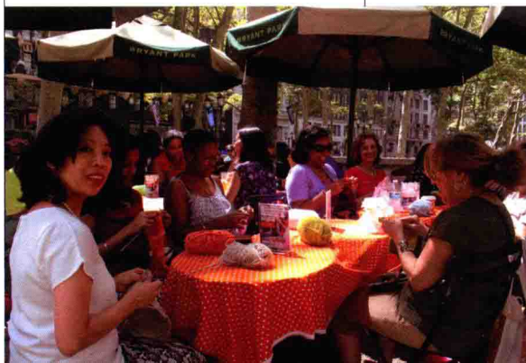
据说已经是第2次参加活动的人们。还有许多人后来到Knitty City毛线店继续编织