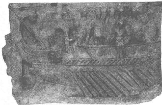
图为罗马附近普里赖斯特的普里米尼厄运女神神殿里发现的浅浮雕，上面雕刻有一艘古罗马战船，制作精巧，利于作战。天才科学家阿基米得却发明了一种类似起重机式的庞大机械，将罗马人的战船抛来抛去。

几个世纪以来，学者们对阿基米得利用太阳光摧毁罗马舰队的传说一直有所争议。不少学者怀疑这一传说的可靠性，他们认为当时的人不可能了解光学和镜子的知识。特别值得一提的是英格兰的两位教授对这个传说进行了仔细地研究，再次否定了这个传说的可靠性：因为根据光学原理，太阳光在天空中大约有一个 0.5^\circ 的旋角，所以它的射线不是真正平行的，会产生发散，不可能用1个平面镜子有效地集中太阳射线。教授们经过计算后还提出一个推论，如果上千人每人握住一个面积为1平方米的磨光镜，他们同时聚光到一点，仅仅能点燃50米开外的面积为0.5平方米的木头。英格兰两位教授认为，用平面镜反射太阳