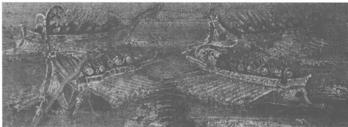
图为罗马战舰正在准备战斗，这些战舰为撞击敌舰都准备了用青铜包镶的船头撞角，不过在攻打叙拉古城的战斗中，这些撞角毫无用处。希腊人阿基米得发明的新式作战手段总是让罗马人吃惊，无奈的罗马统帅马塞拉斯也不得不自嘲：这是一场罗马舰队与阿基米得一个人的战争。