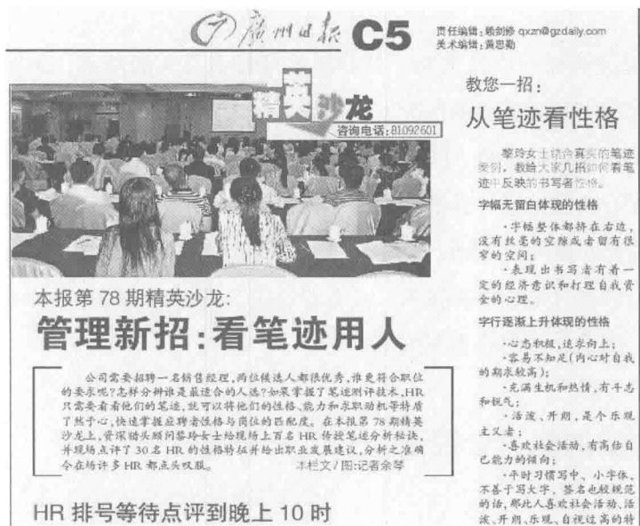
图 1-1 《广州日报》2008年9月1日C5版《管理新招：看笔迹用人》

《广州日报》2008年9月1日报道过这样一条消息：在广州举行的一次精英沙龙上，资深猎头顾问黎玲女士现场为上百名HR传授笔迹分析的秘诀，并随机选取了30名HR，对其笔迹逐一点评并给出职业发展的建议。活动结束后，仍有多位HR希望得到她的点评，直到晚上10点，最后一位满意离去。