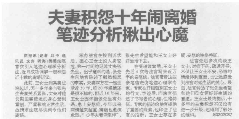
图 1-3 《厦门商报》2010年2月2日A9版

清官难断家务事。对于婚姻纠纷而言，常常“公说公有理，婆说婆有理”，外人很难了解事情真相，这就给法院出了一个难题——为尽量避免不必要的离婚判决，该如何“掺和”才能更有效地调解婚姻纠纷呢？