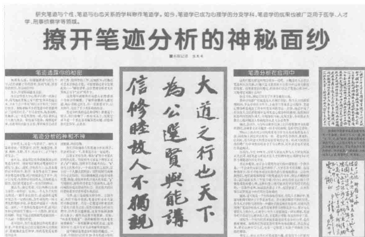
图 1-2 《浙江日报》2009年2月27日9-11版《撩开笔迹分析的神秘面纱》

如果有人对你说，只需任意书写几行字，就能窥视出你的性格、气质，甚至连你过往的经历都有可能“蒙对”，你信吗？