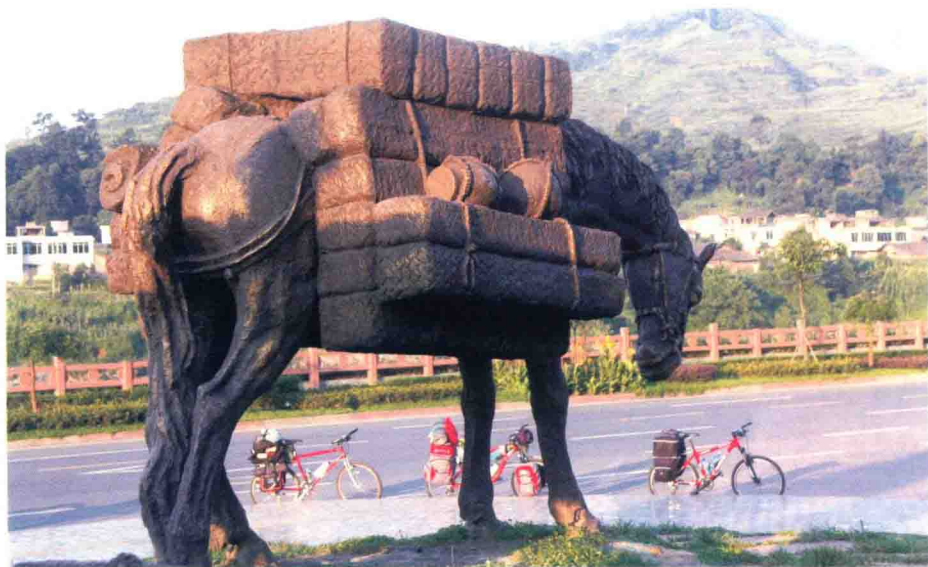
↑ 雅安茶马古道雕塑

雅安以三雅闻名：雅雨、雅鱼、雅女。天晴，无缘见识雅雨；雅鱼太贵，没吃；雅女嘛，在街上还真遇到了几位，只可惜我们还要一路西行，实在不能发生什么故事。