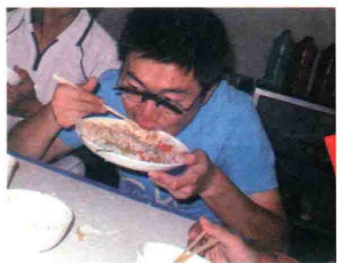
↑ 骑行的最大转变：变成吃货

事实证明饿死鬼不止我一个。下午两点，我们在山坡上的新沟开饭，餐桌上大家风卷残云，菜上来一个光一个，最后菜没了，有人用盘子里的菜汤拌米饭吃，嘴里不停嘟囔着“香”，这样的状况一直持续到拉萨。“我很能吃苦”，这五个字，我成功地做到了前四个。