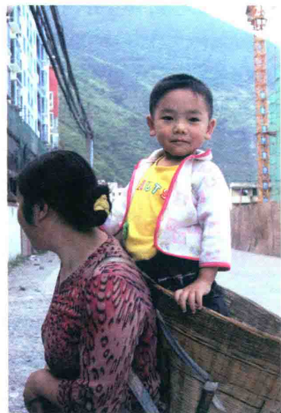
↑ 箩筐：川西一大风景