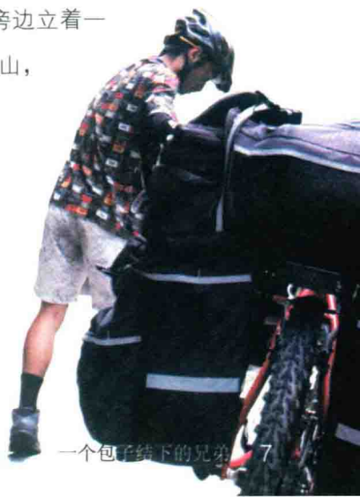
一个包子结下的兄弟 7