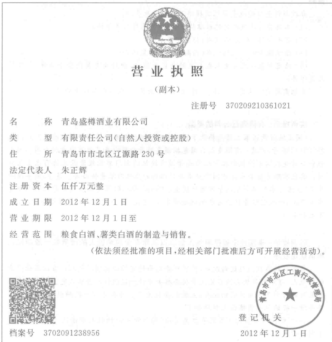
图 1-2 企业营业执照(副本)

(2) 2012年12月3日,从青岛市市北区工商局领取企业营业执照。企业营业执照(副本)如图1-2。