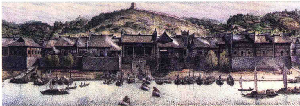
铜官誓港旧景（刘正祥画）