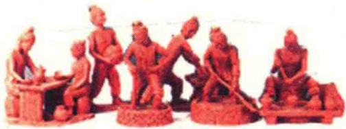
长沙窑传统工艺雕塑图示（雍正刚制）

（1）因为这种“印记”具有历史性、公共性、科学性、艺术性、文化性和实用性，虽搜集了一些经