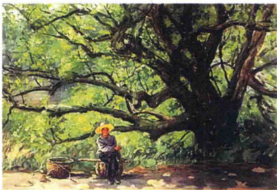
铜官窑头村老樟树