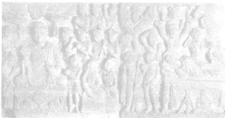
佛陀鹿 野苑初次说法 和佛陀涅槃