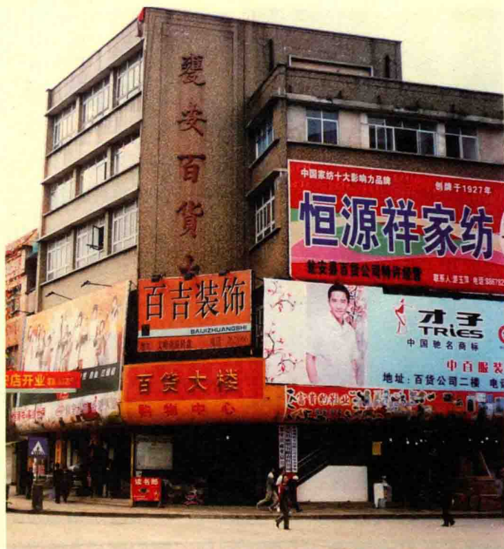
县百货公司大楼（2009年摄）

1988年，在商业系统推行企业承包租赁，落实内外承包，加强经营管理。从1月5日起由五金公司第一家开始到5月18日糖酒公司签约止，133天时间完成10个单位的承包经营合同签订。对百货、盐业、药材（代管）、五金、纺织品、糖业烟酒、民贸7个公司实行承包经营，对蔬菜、饮食服务、糖果糕点厂实行租赁经营。承包、租赁期除饮食服务公司为5年外，其余企业均为3年。各项经济指标分解到门店、班、组、柜，工资、奖金与企业经济效益挂钩，打破“大锅饭”。对百货、盐业、药材实行上缴利润递增包干；五金、纺织、糖酒递增包干，超收全留；民贸公司上缴利润基数包干，超收税前还贷；蔬菜公司上缴租赁费递增包干，亏损自负；糖厂盈亏自负包干；服务公司定死基数，补贴包干。这次承包称为“第一轮承包”。在承包后，商品流转年购进计划800万元，12月底实际完成1009.53万元，占年计划的126.19%，比1987年同比增长12.4%；销售年计划1680万元，实绩完成2068.08万元，占年计划的123.1%，与1987年同比增长13.26%；商办工业产值计划96万元，年底实际完成180.1万元，占计划的187.6%，与1987年同比增长91.58%；实现利润74.95万元，比1987年同期的42.85万元增加32.1万元。