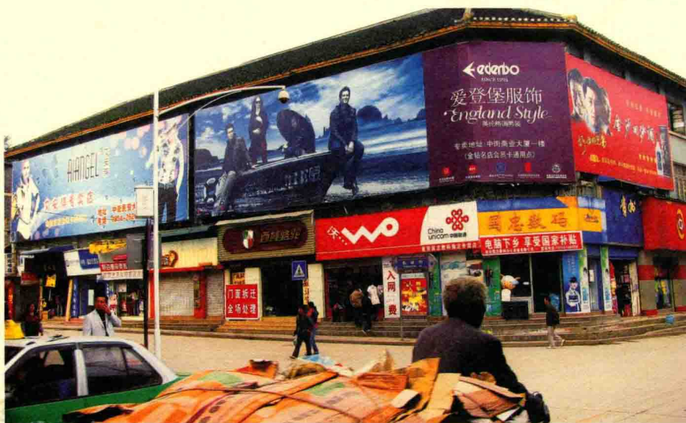
县饮食服务公司大楼（2009年摄）