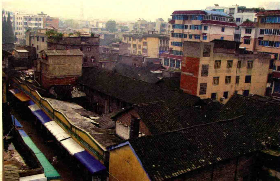
百货公司仓库（瓦房）及饮食服务公司门面小吃街（2009年摄）

1993年，对百货、民贸、五金、肉联厂、食品、蔬菜、盐业7个单位实行为期一年的第二轮次承包顺延工作。五金、纺织、民贸、糖酒、糖酒合营、百货为民商店、饮食服务、食品8个单位和4个下属