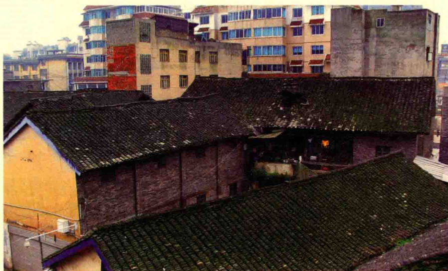
拆迁前的饮食服务公司宿舍（2009年摄）

五交化公司 1978—1987年，为三级五金交电化工商品批发专业公司，业务对象主要是区供销社、集体、个体。经营方式为批零兼营，主要经营五金、交电、化工等。1990年，商品购进总额83.1万元，销售总额295.7万元，库存总额41.5万元，实现利税14.60万元。销售总额比1980年增长1.59倍。1992年，兼并雍阳镇中医院改造成“国