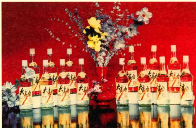
20世纪80年代生产的玉山大曲白酒（1985年摄）

酒类 1978—1984年，全县只有县酒厂和供销社的8个酒厂生产酒，年产量在200~300吨之间，均为散装，且实行凭票证供应。1985年，产销放开，国营、集体、个体多渠道经营，糖业烟酒公司酒类销量下降，只在批发环节上仍继续收取专卖利润。1987年比1982年增加107个酒厂，酒源增加1.1倍。瓶装酒从无到有，工商局注册有瓮安花竹窖、瓮酒、瓮安大曲、五粮窖酒、玉山特曲、龙坑窖酒等12个品种，外来酒有鸭溪酒、匀酒、董酒、珍酒等。90年代后有茅台酒、泸州特曲、赖茅、匀酒、习酒、郎酒等在县内销售，茅台酒价格年年攀升。