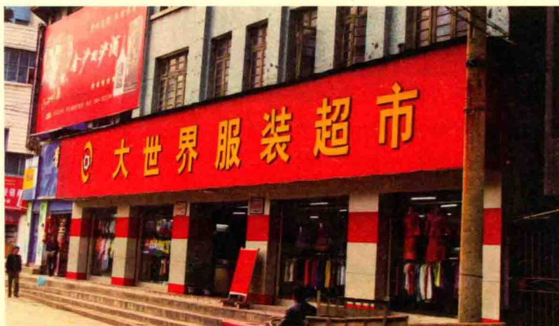
旧城改造前的县饮食服务公司服装超市（2009年摄）

1978年后，改革商品流通体制，疏通流通渠道，商品市场逐渐放开，打破国营、供销垄断商品市场的局面，国营、集体、个体商业城乡一体化，商品品种繁多，高新科技电子产品不断上市。商业部门计划管理的商品逐步缩小，仅有生猪、蔬菜、棉纱、食糖、名酒、卷烟、汽油等110种。1984年后，根据商业部和省商业厅的指示，进一步缩小计划商品范围，原来实行指令性计划的商品由40种减少为