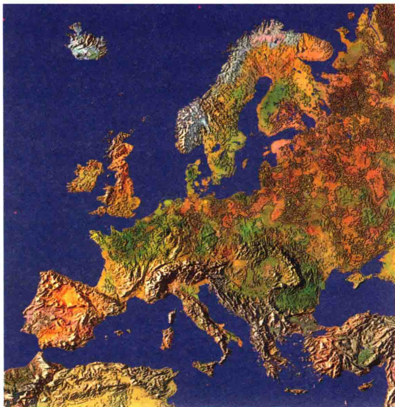
图 1-1 欧洲地形图

与此同时，由于地球自转的原因，导致欧洲没有受到强热带气旋气候的影响。什么叫作强热带气旋气候？用通俗的语言来说，地球是一个球体，受到太阳的照射。赤道附近由于受到太阳直射，导致海洋大量蒸发。由于地球不停地由西向东自转，因此这些蒸发到空气中的气流也就自然而然地由东向西流动。本来气流只是沿着赤道向西流动，然而别忘了，地球自转的时候还会产生偏转力。当地球绕着地轴自转的时候，赤道转动的距离无疑是最长的，速度也是最快的。而纬度越高，转动的距离就越短，速度也就越慢。