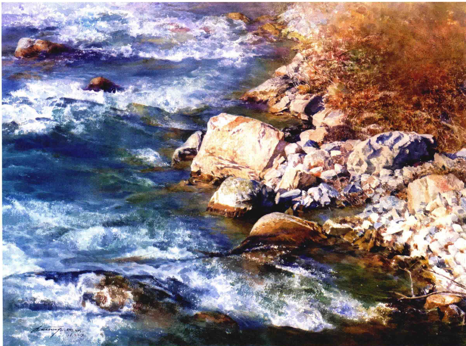
山涧之三，56cm×76cm，纸上透明水彩，周天涯 作