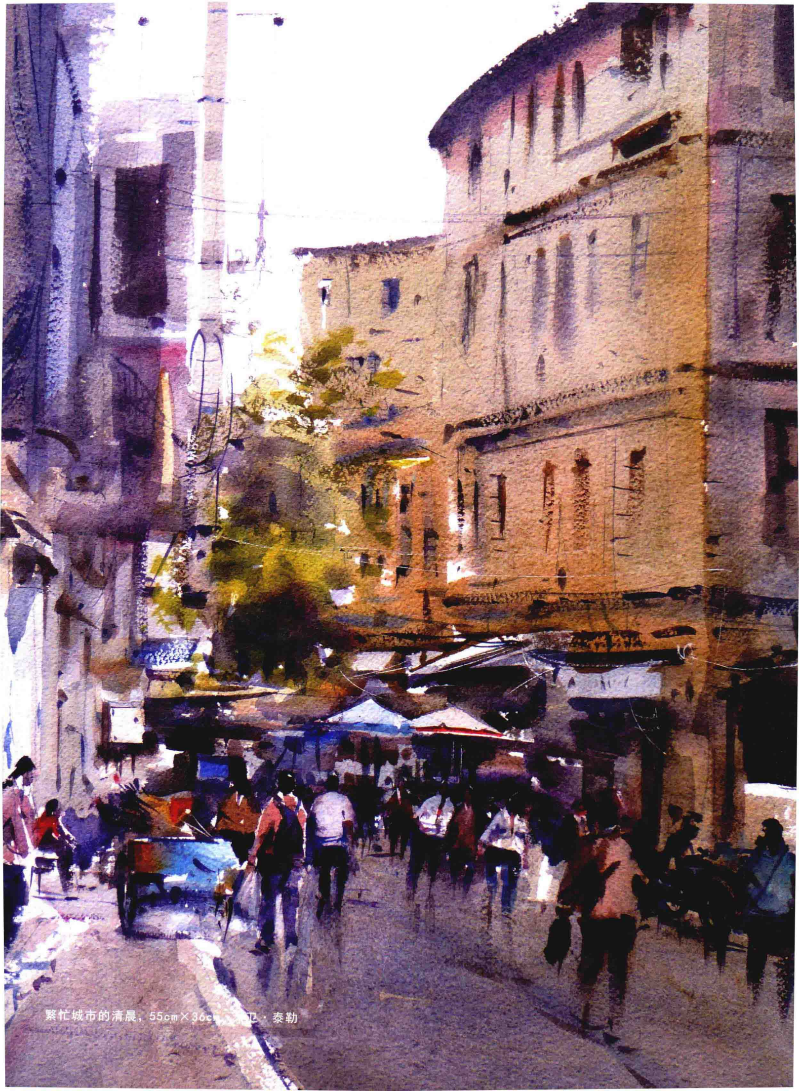
繁忙城市的清晨, 55cm×36cm, 卫·泰勒