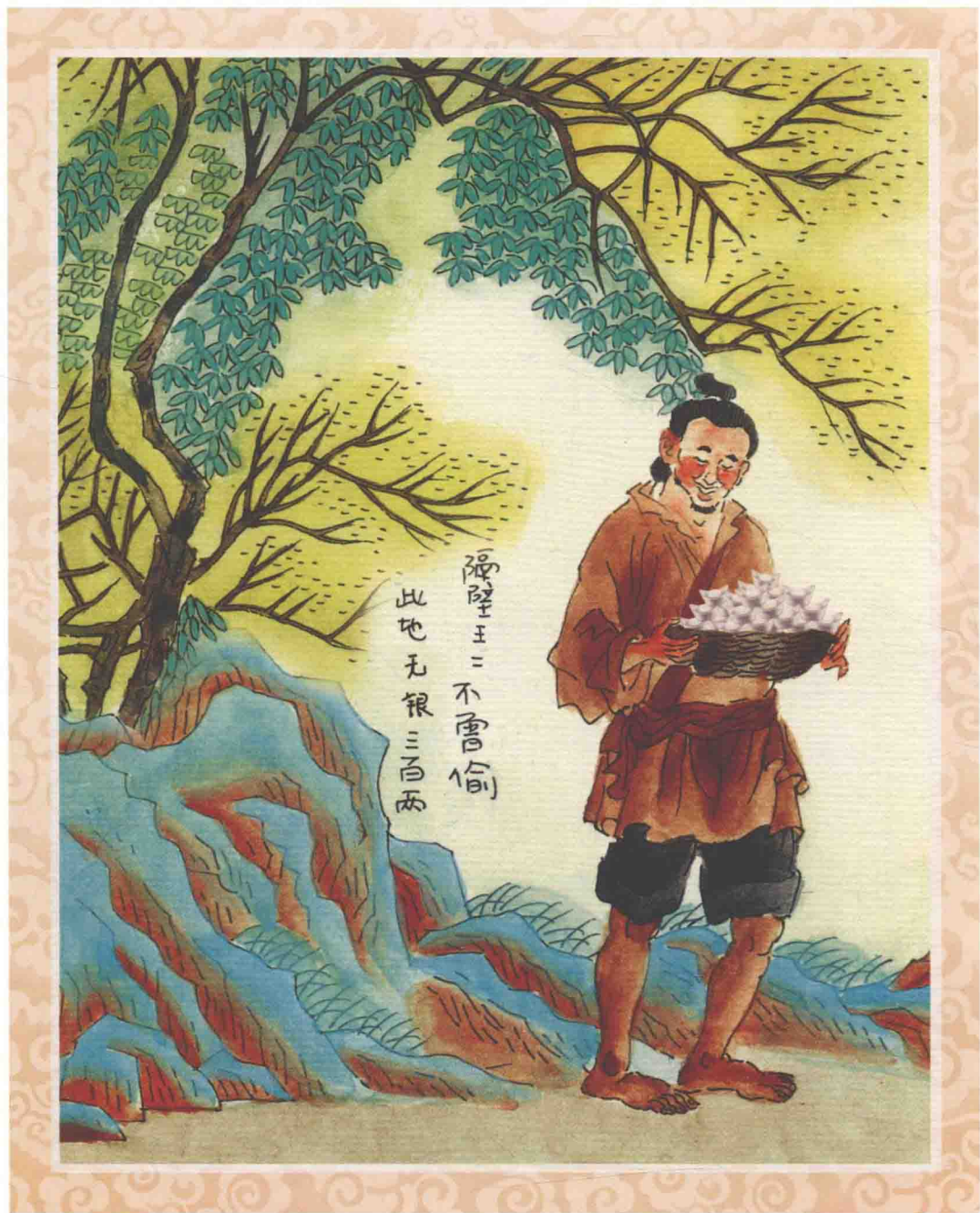
王二偷取屋后银两