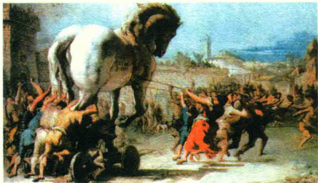
表现特洛伊战争的想象图

《伊利亚特》题名的原意是“伊利昂的故事”,写的是希腊人围攻特洛伊城的故事,当时的希腊人称特洛伊为“伊利昂”。关于这次战争的起因,在神话故事“不和的金苹果”里有详细的说明。