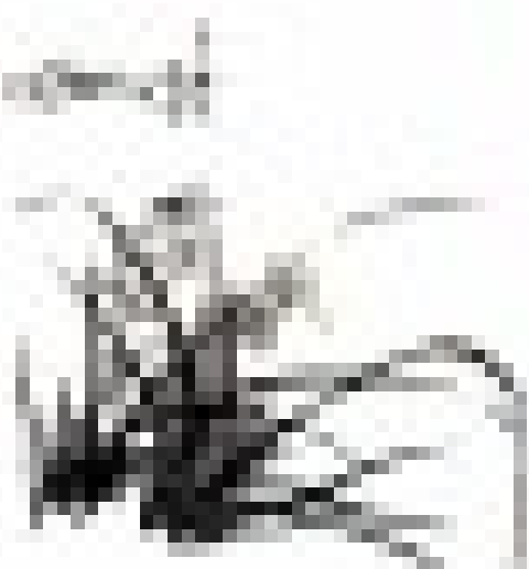
圖 11 幼童在木台上