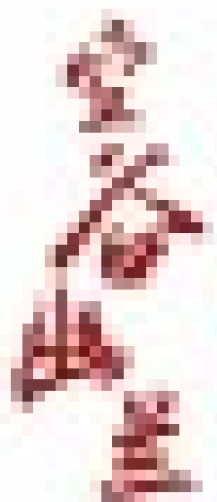
圖 10 幼童在木台上