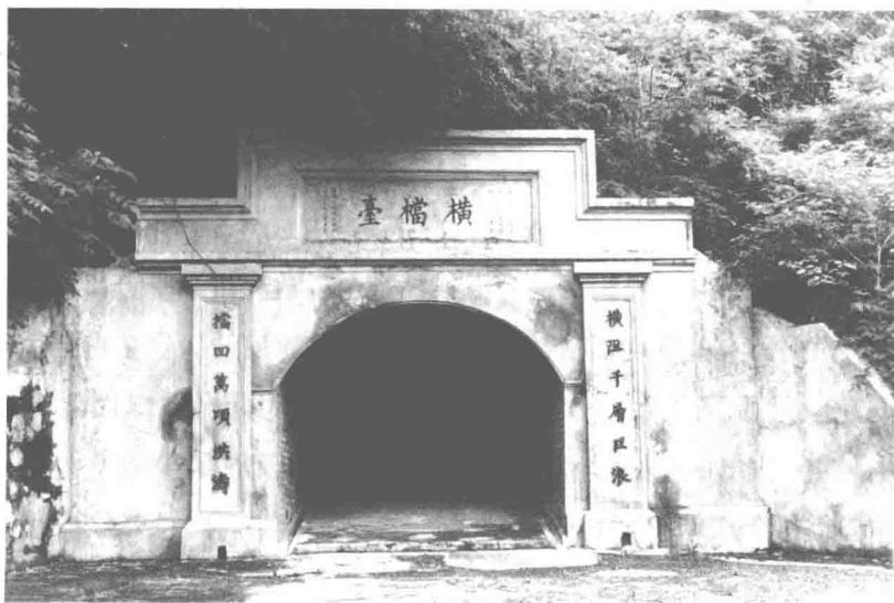
图1 修复后的炮台门楼上被错误题写上鸦片战争时期“横档台”的名字

国重点文物保护单位的文件中有“林则徐销烟池及虎门炮台，位于东莞市”。这等于说全国重点文物保护单位虎门炮台的范围不包括虎门主航道以西的广州部分的各台。对此1985年国家文物局就发文进行了修订，指出虎门炮台“其范围除分布于东莞县境内的4个炮台外，分布于番禺县境内的大角、蒲洲、上横档、下横档等地的其余6个炮台亦应包含在内，鸦片战争时期所有的这10个炮台（虽然以后曾陆续加以修过）都应着重加以妥善保护”。这里的错误在于蒲洲炮台不是鸦片战争时期的炮台，而是光绪时期的炮台，和鸦片战争无关。另由于认为有清一代虎门炮台的各炮台没有大的变化，不知道横档台、永安台在1843年时已合并为上横档炮台，因而1997年当地的文化部门在修复的光绪时西洋后膛炮炮台门楼上错误地题写上“横档台”（如图1）、“永安台”字样，使横档台、永安台这两个在第一次鸦片战争时存在的中国式前膛炮炮台变成了光绪时的西洋后膛炮炮台。这样的“修复”不仅通过了专业的验收，而且后来又被列入广州出版社2000年出版的《广州文物志》上。这种以讹传讹不能再继续了。