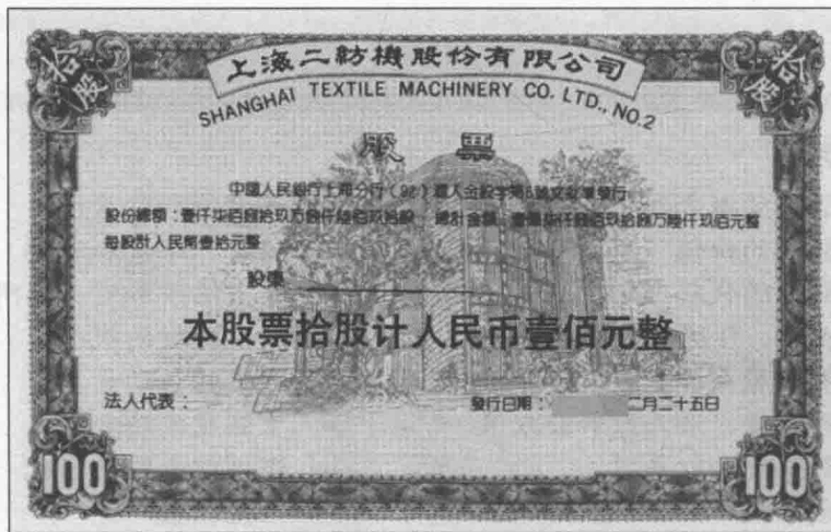
图 1-1 实物股票

在股票电子化以前，股民购买股票的时候可以得到一张印刷精致的纸质凭证，即实物股票，如图 1-1 所示。现如今，实物股票已被我国国家博物馆界定为文物，在日常生活中已经很难再看到。