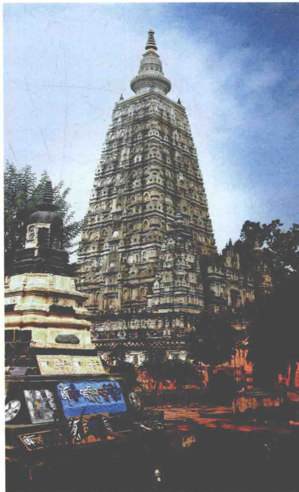
图1-3 印度佛陀迦耶塔

地建造塔庙供养，或凿石室而藏之，佛史上有阿育王造八万四千塔以崇佛的传说。阿育王复派高僧去四方传教，东至缅甸、马来半岛；西至大夏（今伊朗）；北至罽（jì）宾（今巴基斯坦，白沙瓦一带）；南至狮子国（今斯里兰卡）。佛教大盛，传布范围益广，阿育王成为佛教第一位护法的大王。阿育王死后，印度内地佛教反而衰落，其中有一个时期婆罗门教复兴起来。