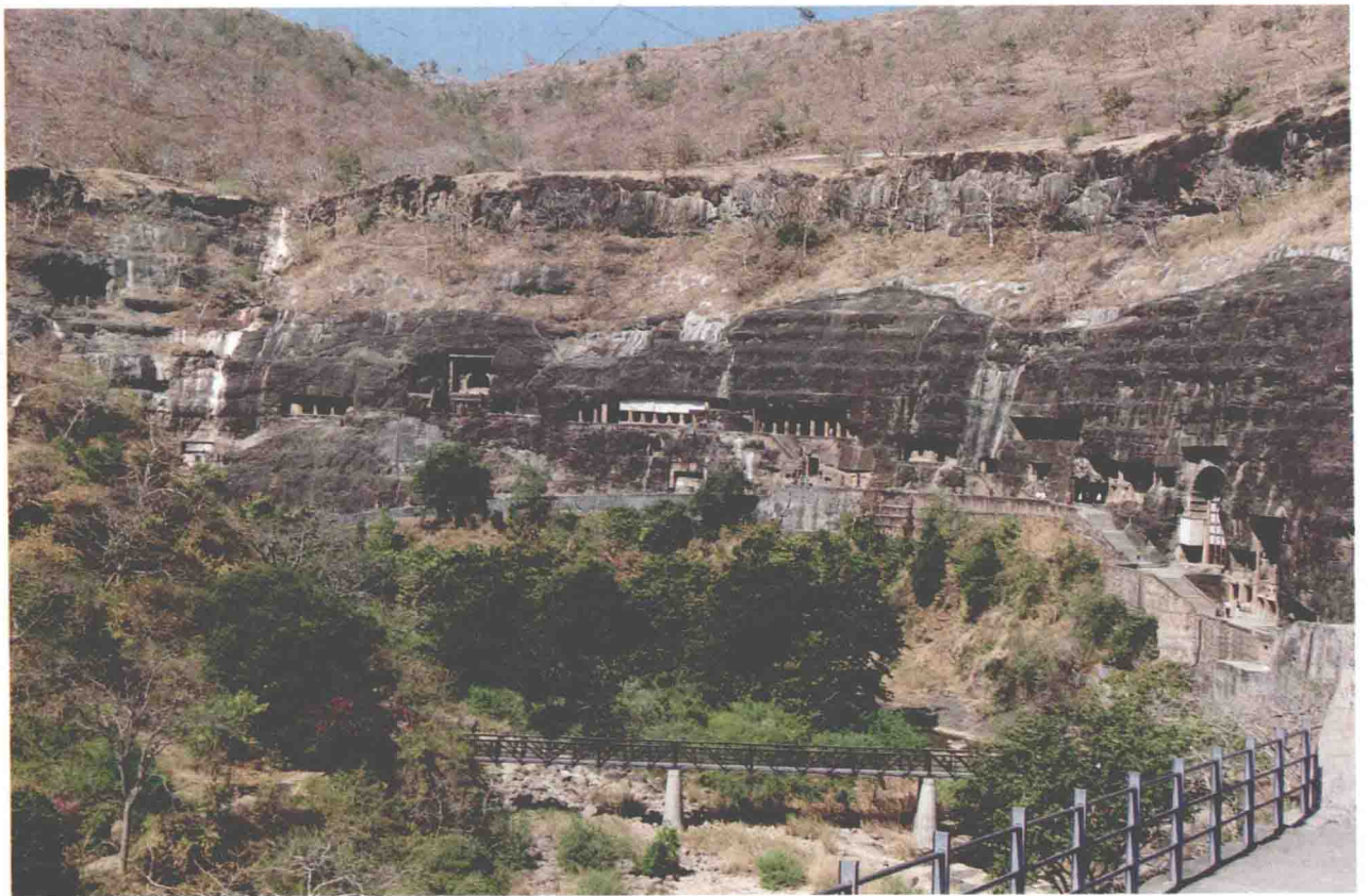
图1-6 印度奥兰加巴德阿旃陀石窟