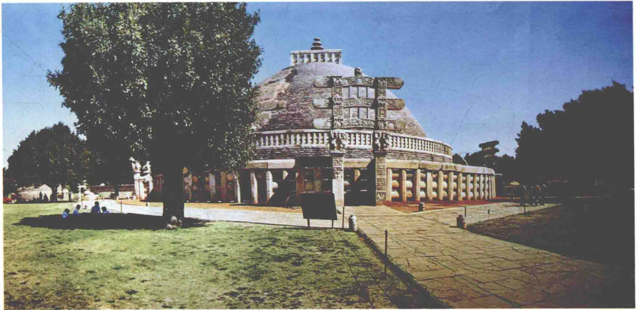
图1-5 印度桑契窣堵坡