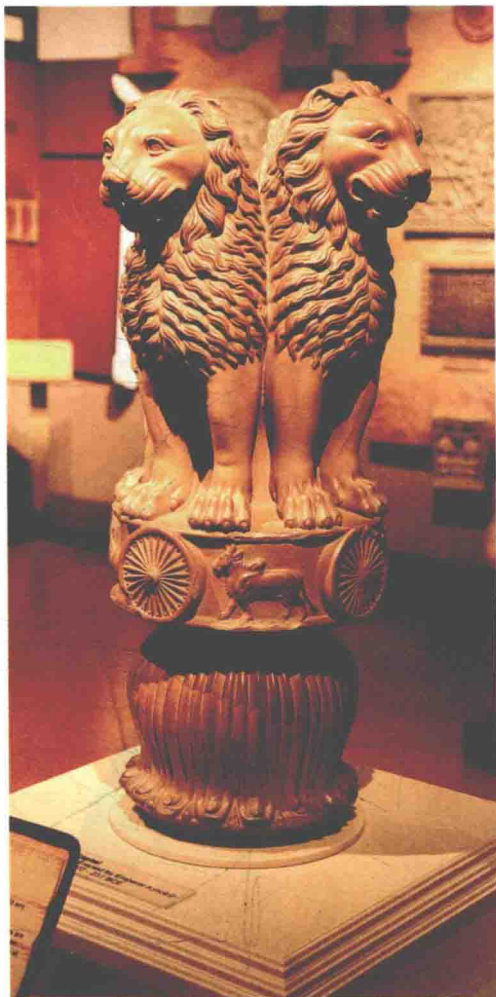
图1-2 阿育王石柱的狮子柱头