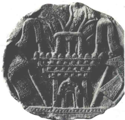
图1-1 表现佛成道处菩提树祠的泥版存波士顿艺术馆

释迦成道以后住在摩揭陀国的首府王舍城传道，国王亦悟道，献出竹园供做寺舍，称为竹园精舍。其间广收门徒，包括其子及姨母皆出家学道。后又去舍卫城传道，波斯匿王为其建祇洹（qí huán）精舍。释迦传道44年后于拘尸国的毗舍离城逝世。释迦逝世后，佛教并没有迅速发展起来，仅限于中印度和东印度地区，不出恒河流域。很快则因为诸弟子争夺道统，阐述教义方面发生分歧，而形成东西两派。这期间虽然开过三次诵经大会，结集经典，以求统一，但未达到目的。佛史称之为三次结集（即王舍城结集、毗舍离城结集、华氏城结集）。释迦死后两百余年，孔雀王朝的阿育王（佛史亦称其为阿输迦王、无忧王）统一全印度，建立统一王国（约当中国的战国末期）。他本人十分虔信佛教，定佛教为国教，在全国颁布敕令和教谕，并建立石柱三十余根（图1-2），刻载释迦遗训，以旌表佛迹，又于摩崖上刻以诰文。为尊崇释迦成道的遗迹，在释迦悟道的佛陀伽耶城的菩提树附近建造大塔（图1-3），绕以玉垣。并将佛舍利（佛的遗骨）分散各