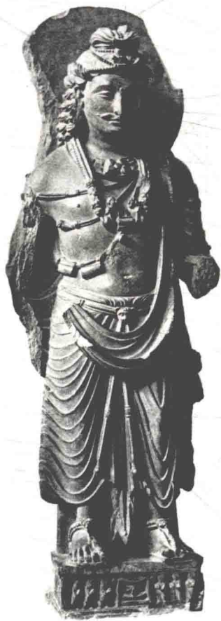
图1-4 犍陀罗出土的希腊风格的佛像 藏新德里国家博物馆