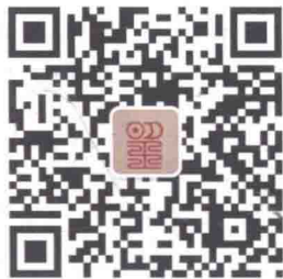
望野博物馆微信二维码