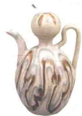
胡姬当垆 / 39