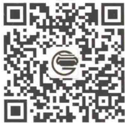
南宋官窑博物馆微信二维码