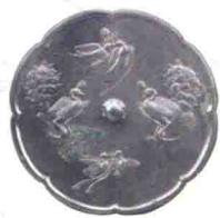
庭院深深 / 95