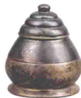
礼佛慎终 / 123