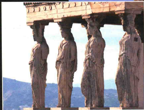
伊瑞克提翁神庙少女像柱

帕特农神庙位于希腊首都雅典卫城古城堡中心，帕特农神庙是供奉雅典娜女神的最大神殿，它从公元前447年开始兴建，9年后大庙封顶，又用6年各项雕刻才告完成。后来神庙毁于战火，现仅留有一座石柱林立的外壳。